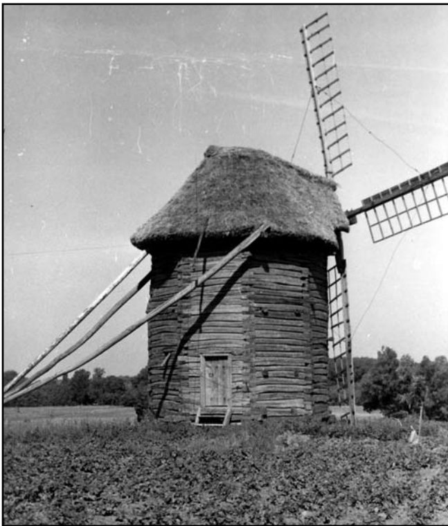
Вітряк с. Ліски Менського району Чернігівської обл.

Ярославецький вітряк був збудований в кін. XIX ст. місцевими майстрами на кошти заможного селянина. Призначався для помелу зерна селянами за «мірчук» (1/10 частина перемеленого зерна). Знаходився на околиці села. Під час колективізації був усуспільнений. До 1968 р. належав колгоспу ім. Щорса. В конструктивному плані двоповерховий, на один постав, виконаний із добірної деревини, восьмигранний, чотирикрилий, на один постав. В основі – невисокий зрубний восьмимерик. Над ним піднімається восьмикутний двоярусний каркас, звужений до верху і обшитий вертикально дошкою-шалівкою. Дах конічної форми, двосхи-