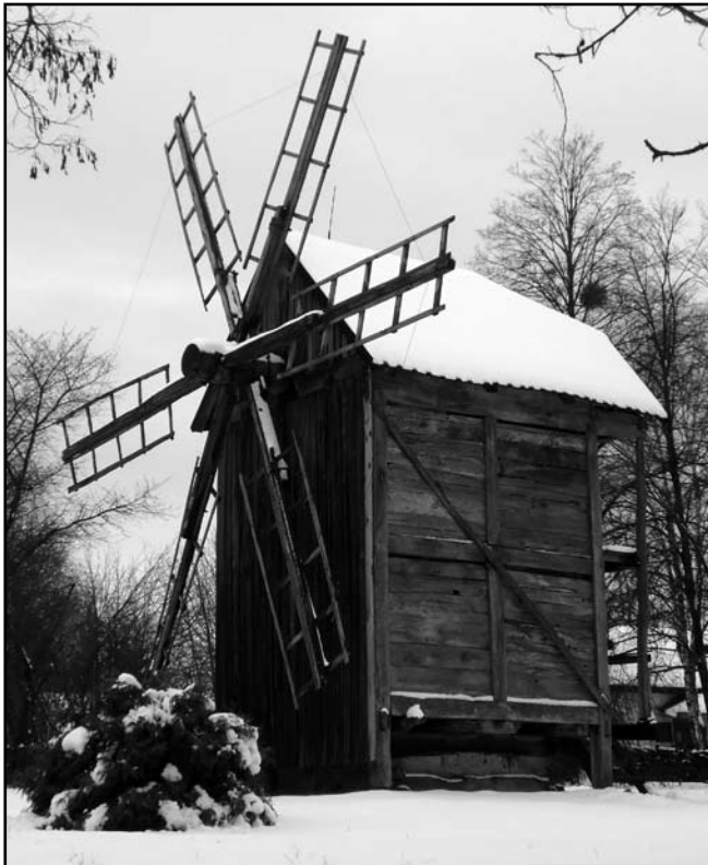
Вітряк с. Довжик Липово-Долинського району Сумської обл.

був усупільнений. До 1969 р. належав колгоспу «Червона зірка». Цікавою особливістю вітряка був розбірний характер конструкції. Млин цей кілька разів продавався, демонтувався і перевозився в іншу місцевість. Незважаючи на багатство будівельного матеріалу, він має скромний зовнішній вигляд. Споруда відрізняється монументальністю, міцністю і надійністю конструкції, стійкістю до руйнації, не містить ніяких декоративних прикрас [6].