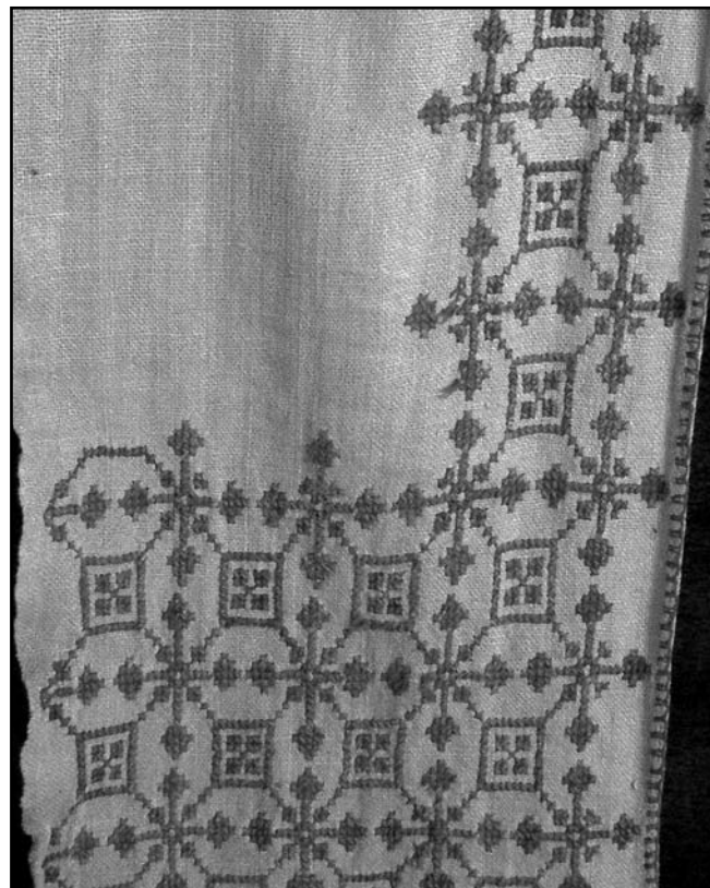
Фрагмент рушника-божника, вишитого хрестиком.

Основою для вишивання служило домоткане полотно (17 од.) та фабрична бавовняна тканина