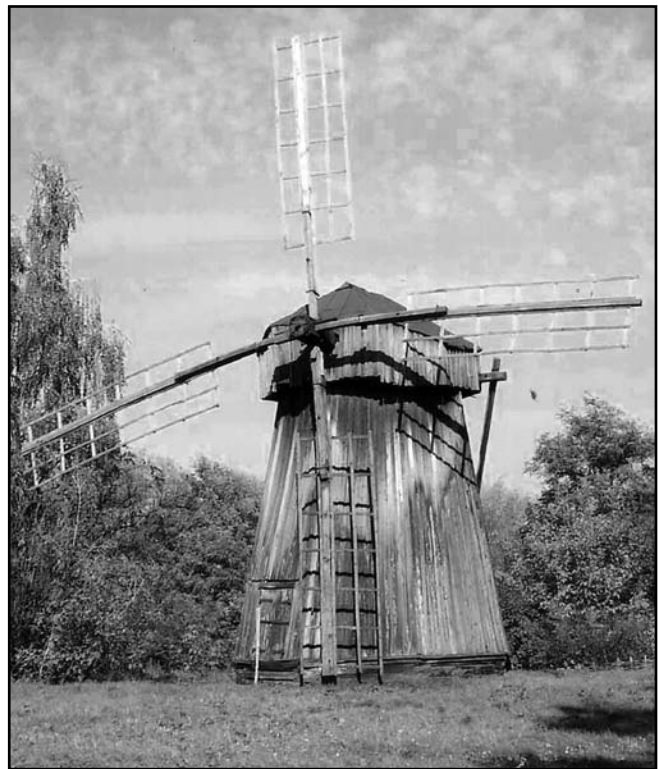
Вітряк с. Ярославець Кролевецького району Сумської обл.

Першим із Сіверського краю до музейної колекції потрапив вітряк з с. Ярославець Кролевецького р-ну Сумської обл. (акт обстеження від 10.07.1968 р.). З'явився він завдяки небайдужій до проблем збере-