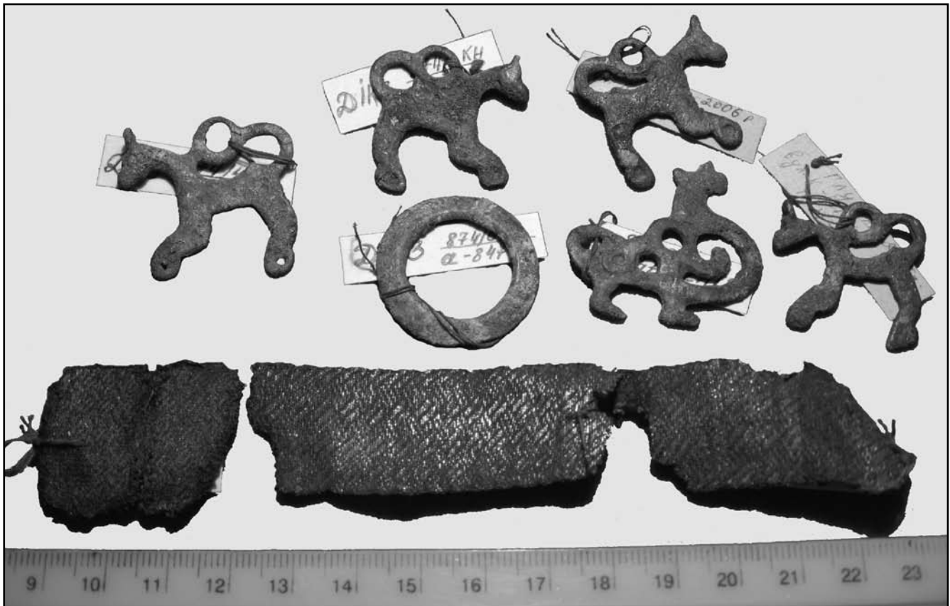
Бронзові підвіски та фрагменти золототканої тасьми з поховання по вул. К.Цеткін у Глухові

Середньоазіатські майстри використовували відносно товсту не скручену пряжу майже однакової якості для основи і для піткання, а в шовкоткацьких майстернях Ірану тканини вироблялись із тонких слабо скручених ниток. Важливою ж особливістю далеосхідних тканин було те, що вони виконувались в техніці основної саржі, тобто на лицевій стороні переважали перекриття ниток основи і на 1 см 2 припадало в два рази більше основних ниток, ніж ниток піткання [7, 60-61].