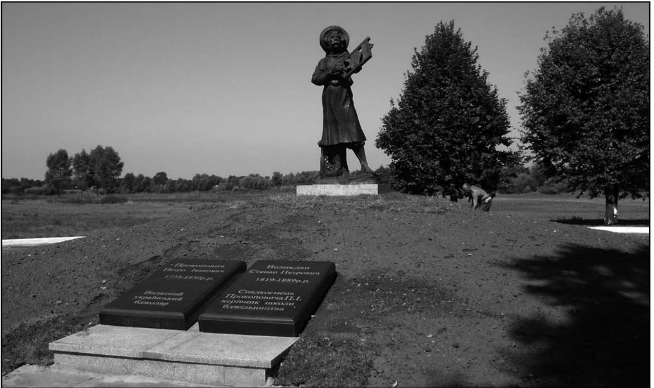
Надгробні плити П.І. Прокоповичу та С.П. Великдану на місці їх поховання

введене в 1832 р., давалося особам, що не належали до дворянського роду. Власник звання мав наступні привілеї: звільнення від рекрутської повинності, сплати подушної податі, право на свободу пересування, вибору місця проживання. Почесний громадянин не підлягав тілесним покаранням, мав право брати участь в місцевому самоврядуванні. Дозвіл на присвоєння звання давав сам імператор [7, 244].