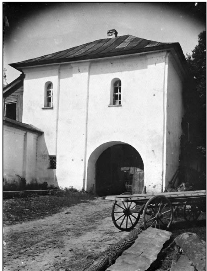
Брама монастиря. Фотографія С. Таранушенка 1930 р.

артикуляції. На іншій фотографії, зробленій у 1930 р. С. Таранушенком, добре видно дві пілястри без баз та капітелей, що оформлюють проїзд, та широкий ризаліт біля південного кута. Віконні прорізи мають вигляд трицентрових арок, характерних для ХVІІІ ст.