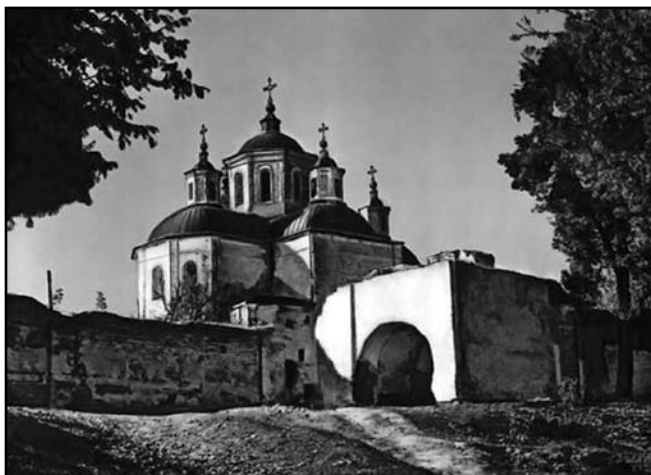
Загальний вигляд брами у 1950-ті роки