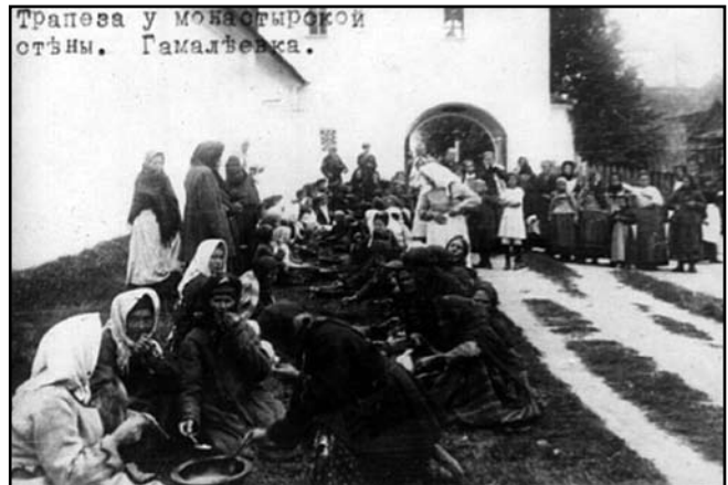
Східний фасад брами. Поштова листівка початку ХХ ст.

На жаль, після пожежі 1795 р. фасадний декор пам'яток монастиря був збитий. Цього, очевидно, не уникла і брама. В усякому разі на листівці початку ХХ ст. бачимо стіни, майже позбавлені будь-якої