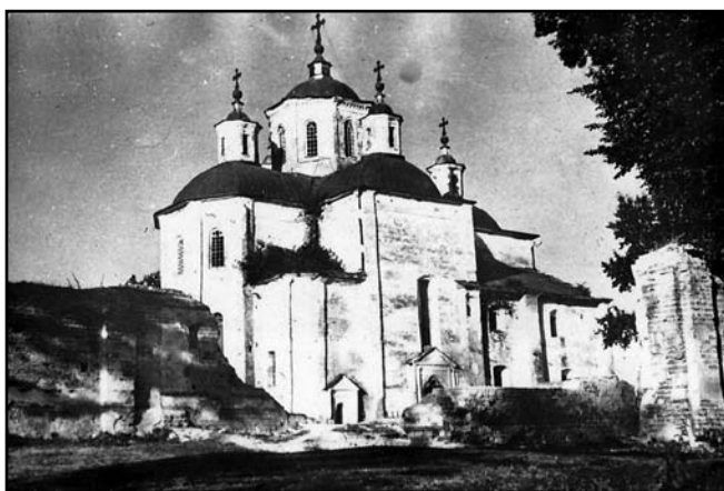
Залишки брами. Фото 1957 р.

міркуваннями загального порядку. Його київське походження вказує, що саме тут потрібно шукати інформацію про його професійне формування. У переліку киян, що присягали на вірність новій цариці 1741 р., серед цехових ремісників ім'я Раєвського відсутнє [9], тому можна припускати, що освіту він здобув у іншому місці.