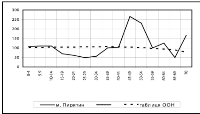
Мал. 2. Вікове співвідношення за статтю

таблиці ООН. Це можна пояснити тим, що «таблиця ООН» створена для закритого населення, а населення ранньомодерного міста було відкритим – воно зазнавало впливів міграцій, участі чоловіків у військових діях, різної смертності тощо. Поєднання різних чинників сформувало і відповідне співвідношення статей сотенного містечка.