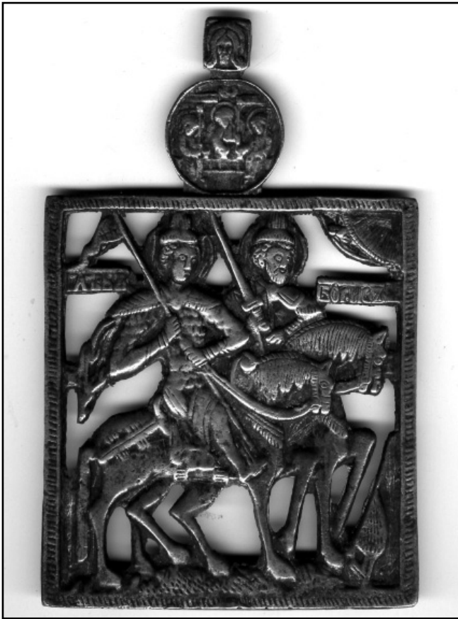
Святі Борис і Гліб. Кінець XVI ст. Бронза, прорізне литво. Знахідка у Глухові