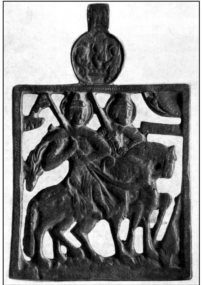
Святі Борис і Гліб. Кінець XVIII ст. (по моделі XVI ст.). Червона мідь, прорізне литво. Рязанський історико-архітектурний музей-заповідник