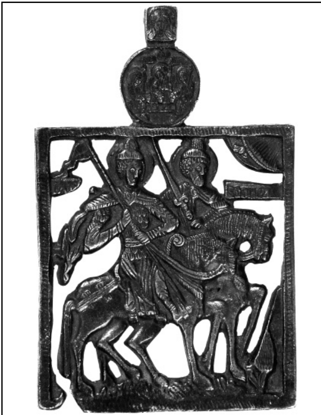
Святі Борис і Гліб. XIX ст. (по моделі XVI ст.). Мідь, прорізне литво. Пермська державна художня галерея

умовне позначення уявного краєвиду у вигляді смуги землі з деревцем, стрічки з іменами князів, згадані одяг і небесна сфера. Рисунок фігур князів та їхніх коней можна вважати вдалим, особливо з огляду на вимоги пластичного мистецтва, так само, як і характер рельєфу. Відлитий твір додатково оброблено різцем. Вузьке обрамлення вкрите навкісними насічками, перетвореними на елемент декору. Ремісник, напевно, ручним способом вирізував залишки металу, і деякі з них полишив з якихось причин. Імена князів рельєфні, зроблені добрим епіграфічним уставом. Все описане свідчить на користь московського походження твору, ймовірно, наприкінці XVI ст. До того ж ще слід додати відтворення відомої композиції Трійці Андрія Рубльова у невеличкому медальйоні вгорі, до якого приєднано вушко з образом Нерукотворного Спаса. Все це зроблено одночасно при виготовленні іконки. Не виключено, що при цьому в якості моделі використано різьблену панагію таки московського походження [2].