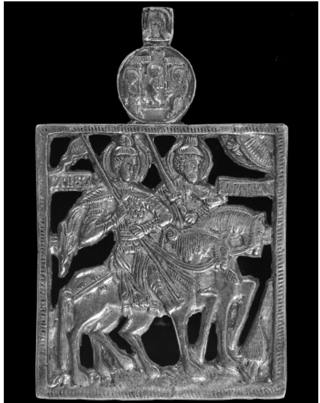
Святі Борис і Гліб. XIX ст. (за іконографією XVI ст.). Мідь, прорізне литво. Челябінський обласний державний музей мистецтв

Сама ж іконографічна формула святих вершників візантійського походження, але набула