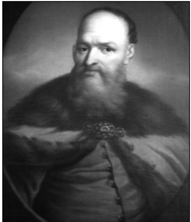
Рис. 4. Польський генерал Стефан Чарнецький

впритул до фортеці, були встановлені дві артилерійські батареї: одна нараховувала дванадцять, друга – шість гармат. Штурм розпочався, як і першого разу, відразу після підриву мін на світанку. О шостій годині ранку піхота при підтримці майже всієї кавалерії кинулась у проломи. Увірвавшись до фортеці, поляки відрубали голови всім захисникам, котрі обороняли місця проломів, і, пробившись до найвищої точки фортеці,