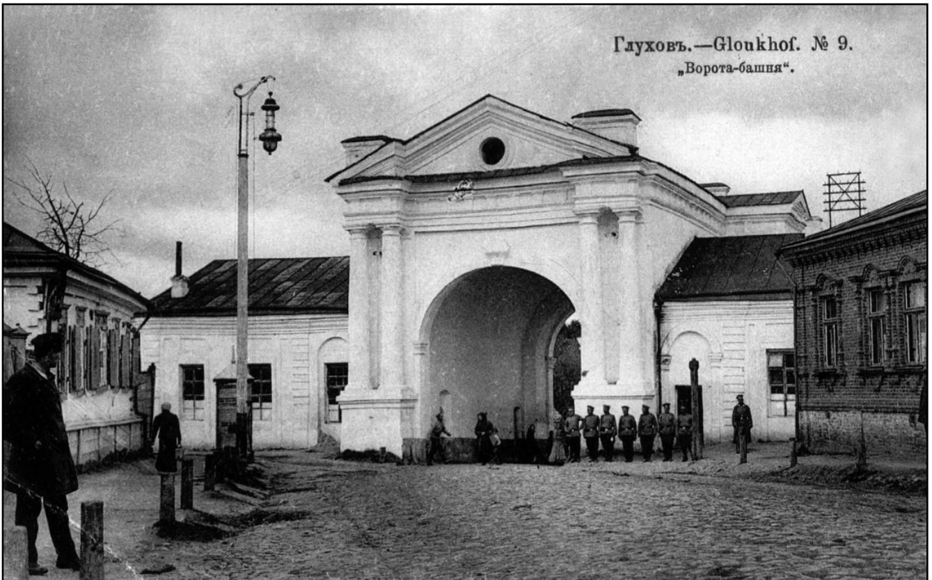
Рис. 8. Київська фортечна брама з кордегардіями

стояли осторонь щільної дерев'яної забудови, вигоріли зсередини. Після цієї пожежі місто втратило свою столичну велич і набуло рис рядового повітового містечка.