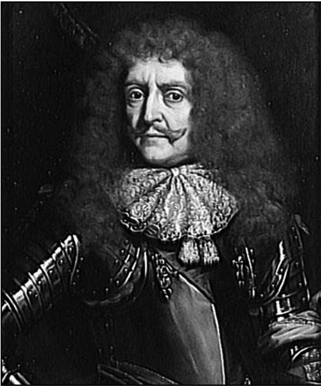
Рис. 2. Французський посланець герцог Антуан де Грамон граф де Гіш