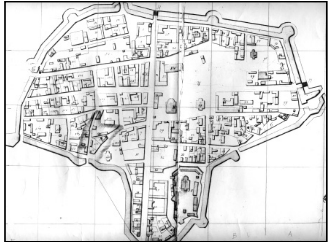
Рис. 6. План Глухівської фортеці 1750 р., укладений квартирмейстером Магнусом фон Рене

Навесні 1711 р. під час своєї подорожі до Києва у Глухові зупинявся датський дипломат Юст Юль. У своєму щоденнику він дав коротку характеристику глухівській фортеці, у якій зазначено, що після