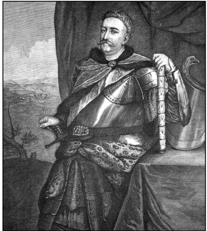
Рис. 3. Коронний великий хорунжий Ян Собеський