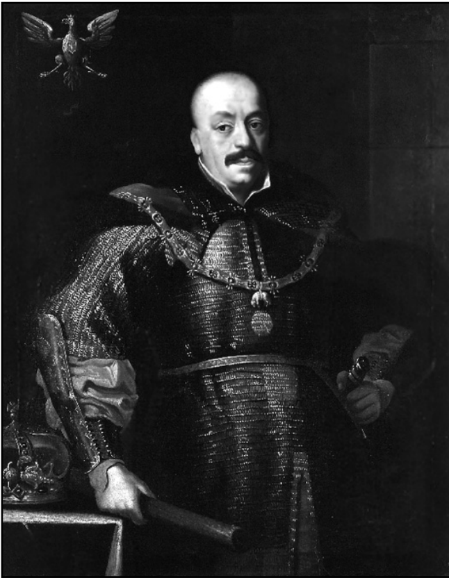
Рис. 1. Польський король Ян II Казимир

на яких було насипано вали та збудовано частокіл. З північного боку підходила природна перепона – заплава невеликої річечки Малотечі. Південна та східна сторони були укріплені викопаним ровом і насипаним валом. Зберігся опис Глухова 1654 р., зроблений під час приведення до присяги глухівських козаків та міщан після Переяславської ради: «...А город Глухов стоит меж речки Усмани на острову. Около посаду, меж речки, землею город. На старосвитцком городище сделана два вала земельных; около тех валов два рва; на том валу надолбы; меж тех валов башен нет. В том землею городе поставлена церковь деревяная во имя архангела Михаила; у тое церкви служащей поп Григорей. Да подле того ж земельного города поставлен был Песочинского пана двор на горе над речкою Усмани; около того двора, с трех сторон осыпь земляная; на осыпи поставлен острог дубовой; межи того острога сделаны ворота проезжие, на воротех и глухих наугольных башен меж того острога нет. Около того острога сделан ров, а ров к острогу огорожен бревнами с одной стороны, и подле того острога у земли сделан честик, колье дубовые, да около слобод того города Глухова на всполье сделал ров для приходу воинских людей. Да к тому ж городу Глухову уездные села...» [8]. З цього опису можна зробити висновок, що Глухів мав складну тридільну систему укріплень: замок, укріплений двір Пясочинського та слободу, захищену від поля ровом [9, 208]. Незважаючи