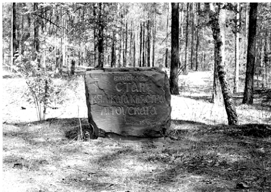
Пам'ятний знак на місці військового табору армії ВКЛ. Публікується уперше. Фото люб'язно надане М. І. Анісовцем).

почестями за старим козацьким звичаєм на високій могилі (вочевидь, на якомусь кургані. – І. К.). Голландський живописець Абрахам Ван Вестерфельд зняв з обличчя Кричевського посмертну маску. 5-6 серпня, побоюючись нового удару, гетьман відвів армію за стіни Речицького замку, тоді ж був надісланий загін до Брагіна, щоб вибити звідти козаків. Сам Радзивіл ще кілька днів перебував у Лоеві 77 .