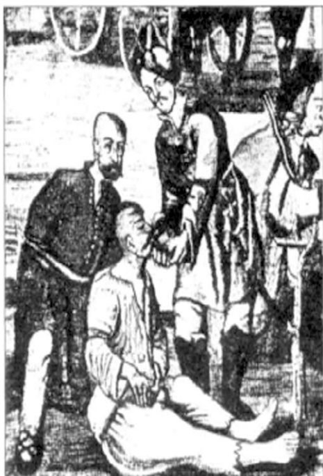
Поранений Михайло Кричевський (фрагмент gobелена 70 )

На півдні від Лоева неподалік Дніпра розташоване урочище з цікавою назвою Разгром. На думку лоевського історика-краєзнавця М. Анісовця, саме тут відбулася завершальна битва 31 липня 1649 р. Ще один цікавий топонім – Грядки, у густих хащах на відстані близько 3 км від Лоева та 200 метрів від Дніпра, майже у центрі урочища Розгром. Грядки – це майданчик округлої форми площею близько двох гектарів, оточений трьома паралельними валами висотою до 3 метрів. Вочевидь, саме це давнє городище (ймовірно, ще залізного віку) стало останнім bastіоном козацького війська. «Інакше (як зазначає М. Анісовець) не можна пояснити, яким чином козаки змогли швидко побудувати майже неприступні укріплення» 66 та дві години захищатися від значно чисельнішого війська ВКЛ 67 .