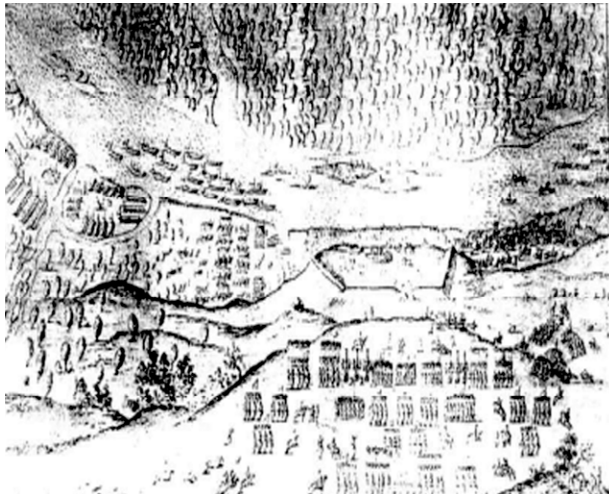
Взяття Лоева військами Радзивіла (гравюра 1649 р.) 25 .

та гусарського поручика Самуеля Коморовського, разом близько 2 тис. вояків 27 ). Але стався конфуз – Шварцгоф прийняв литовські війська за козацьку армію, підпалив посад міста, а сам сховався у замку. Це примусило Радзивіла забрати Шварцгофа з собою (нім були невдоволені речиські міщани), залишивши чатувати місто Абрахомовича 28 . Дізнавшись від селян, що Радзивіл будує новий табір біля Лоева, Кричевський приймає рішення змінити напрям руху – від Речиси до основних військ ВКЛ 29 .