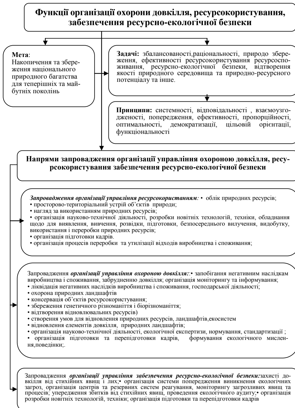
Рис. 2. Модель організації управління охороною довкілля, ресурсокористування, забезпечення ресурсно-екологічної безпеки в організаційно-управлінській системі природокористування