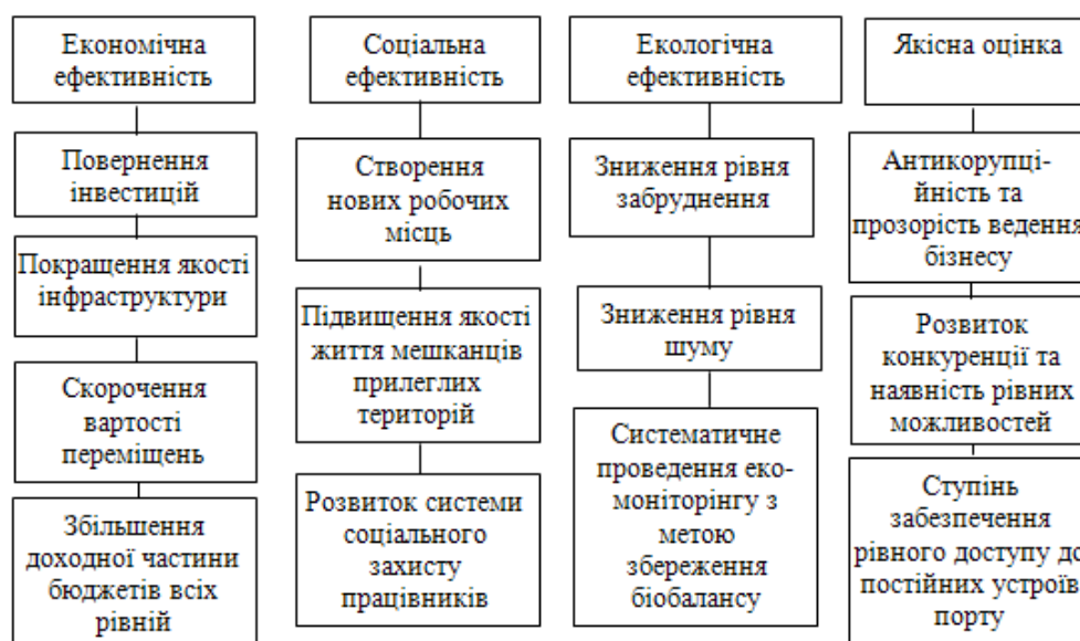
Рис. 1. Основні критерії пріоритетності здійснення портової політики

Крім того, до економічних чинників слід віднести фінансове планування діяльності підприємства, аналіз та пошук внутрішніх резервів зростання доходів та прибутку, механізми економічного стимулювання діяльності, податкове планування.