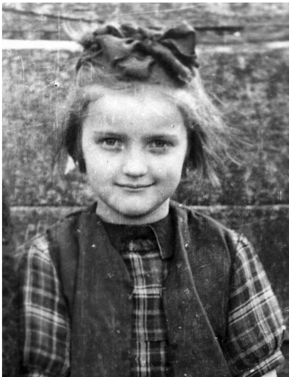
Ігри закінчилися, ідемо до школи. Село Городище на Ходорівщині. 1947 р.

і “відпекатись”. І так цілий день, у русі, у вигадках, у невтомній праці мозку, рук і ніг. Упав би ввечері у постіль і забутися до ранку, але ще треба помитись, повечеряти і, що особливо відповідало, засереджено помолитись. І стає, радше падає на коліна чемна дитина, складає рученята, зводить упокорені очі на Боженьку. Не зчулося – уже й сидить, напівсонно шепче молитву, і от уже ловить себе на тому, що замість “Отче наш” – рахує. Поривається розпочати все заново, і, нарешті, скінчивши молитву, засинає міцним дитячим сном.