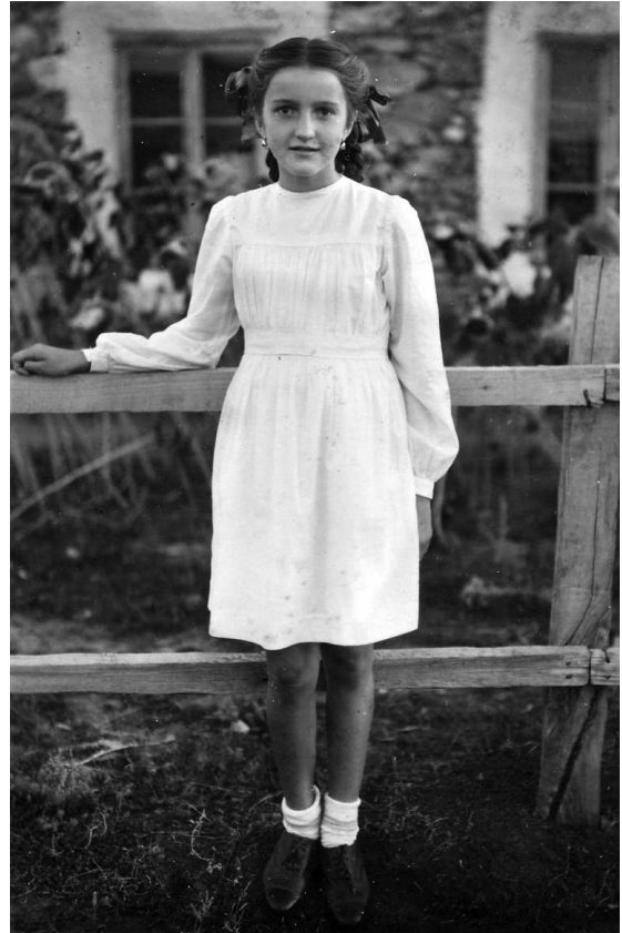
П’ятикласниця у білому. Село Мостове. 1952 р.

бік. На щастя, бика у стаді не було, а то, враховуючи колір наших прапорів, вийшла б корида. Мукання і мекання остаточно заглушили наш бравурний спів, який переливався у сміх, регіт. Потіха була люксова.