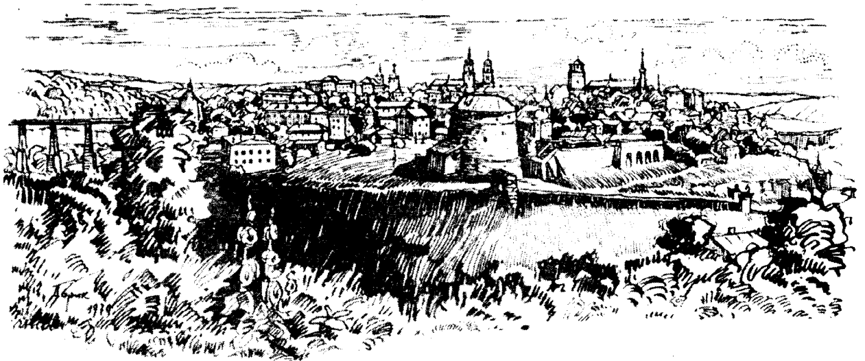
Панорама Старого міста Кам'янця - Подільського

Особливість національного парку полягає в наявності Товтр - залишків рифового бар'єру Сарматського моря і Дністровського каньйону, де виходять на поверхню і відкриваються для споглядання геологічні породи древніх епох.