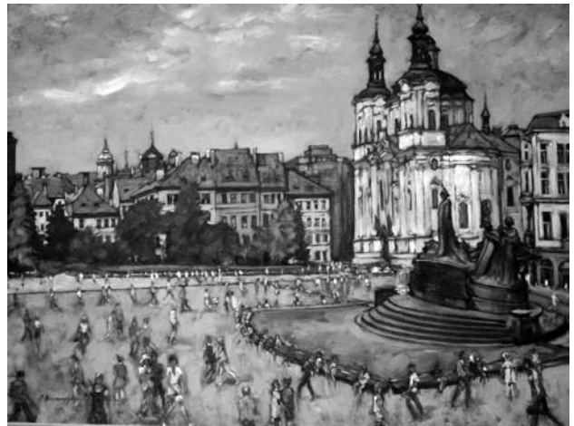
Павло Громницький. Старомістська площа в Празі. 1971 р.