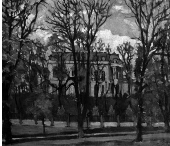
Павло Громницький. Осінній пейзаж. Прага, 1931 р.

У роки Другої світової війни художник з родиною мешкав у Річанах біля Праги. Це гарна