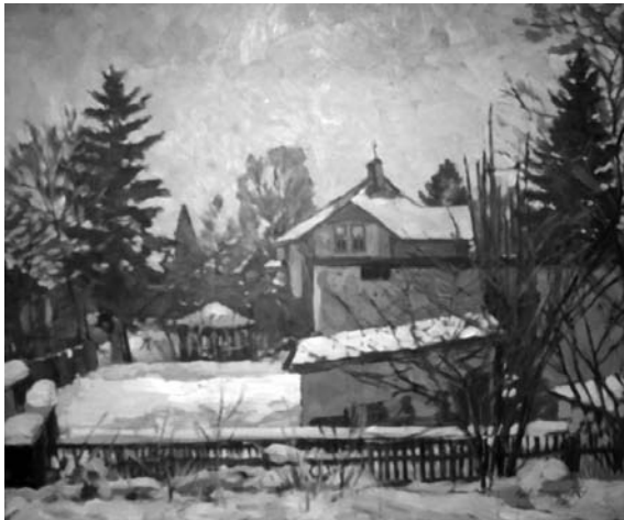
Павло Громницький. Зимовий пейзаж. 1960-ті рр.