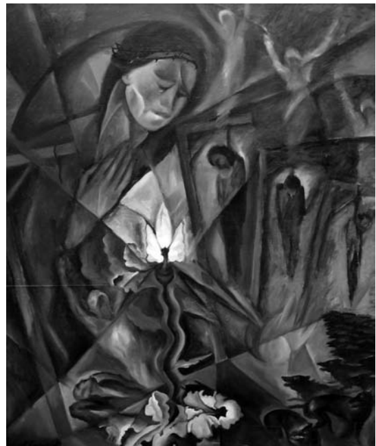
Павло Громницький. “Розп’ята Україна” (можливо “Пієта або з жертви сила”). 1932 р.