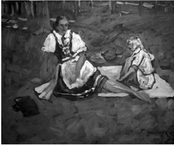
Павло Громницький. Портрет дружини з донькою. 1939 р.