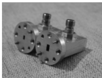
Рис. 1. Широкополосные детекторные устройства

Здесь C_j и C_{констр} — емкость барьера и конструктивная емкость, соответственно; r_s — сопротивление потерь; n — показатель неидеальности вольт-амперной характеристики; U_{обр} — обратное напряжение (при токе 10 мкА).