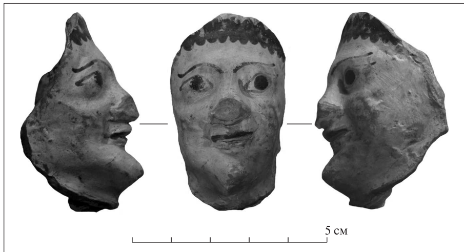
Рис. 1. Ольвія. Теракотова голівка від хіоської чаші

зував на наявність характерних рис мистецтва архаїчної Іонії, що й звузило коло пошуків. Візуальні ж характеристики глини демонстрували подібність до керамічних виробів, що походять з о. Родос, проте за якістю зовнішньої світлої обмазки найбільшу схожість було знайдено в керамічних фрагментах з Навкратіса (Леви 1941, с. 310—312).