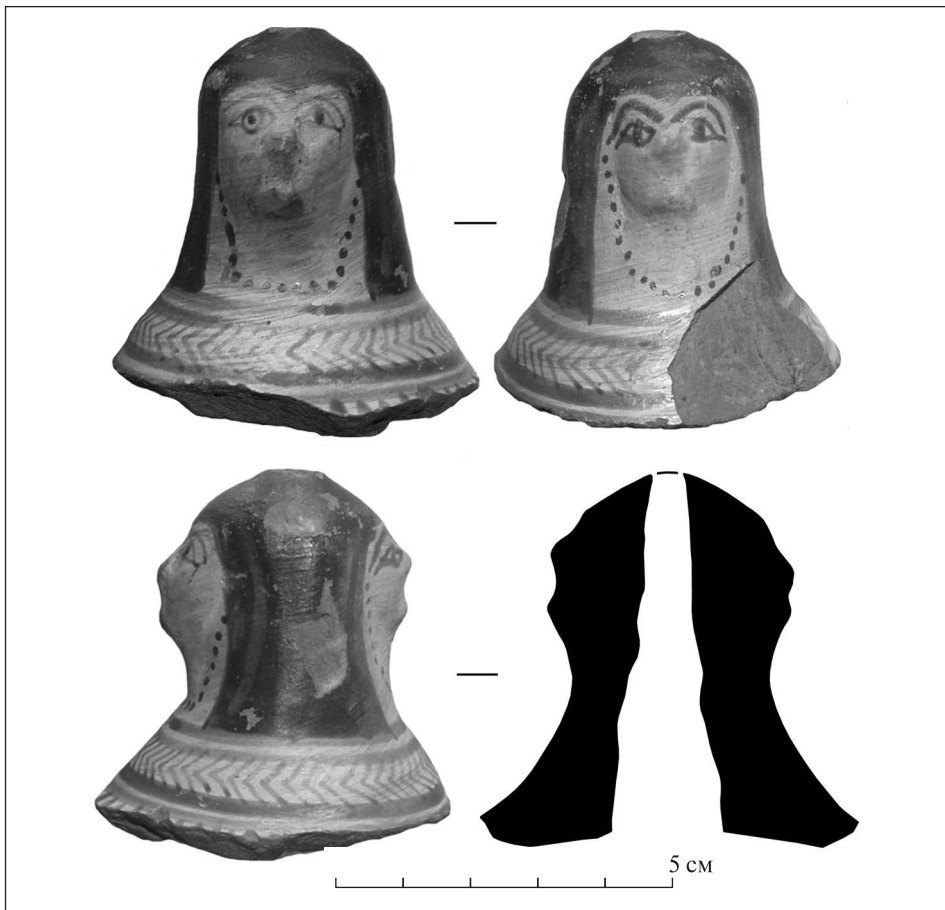
Рис. 3. Борисфен. Теракотова голівка від хіоської чаші

ної керамічної продукції Хіосу. І саме в ній була чітко атрибутована ольвійська голівка, а на підставі цілої низки подібних фрагментів встановлено, що це — жіноча протома. Цікаво, що за стилістичними ознаками, насамперед за манерою передачі зачіски, в хіоському вазописі вона має найбільше відповідностей саме серед сфінксів (Lemos 1991, p. 127, 203, fig. 69). Більша частина таких фігурних голівок зазвичай прикрашала краї великих відкритих, діаметром до 40 см, та глибоких, заввишки близько 18 см, посудин на широкому кільцевому піддоні, як у відомій «чаші Афродіти» з Навкратиса (рис. 4) 5 . Вони мали по дві ручки, вертикально посаджені на відігнутому краї, та фігурні декоративні прикраси у вигляді жіночих протом (Lemos 1991, Nr. 1397; Möller 2000, p. 249, Nr. 2b). Дві пари рельєфних односторонніх протом прикріплювали по обидва боки від вертикальних