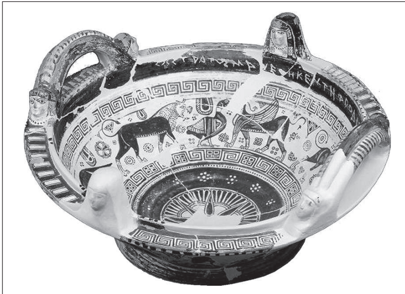
Рис. 4. «Чаша Афродіти» з Навкратіса

Афродіти», незважаючи на дрібні відмінності в передачі додаткових елементів декору на самих голівках. Найважливішим показником є, найімовірніше, розміщення теракотових прикрас і складної за формою ручки на посудинах за єдиним композиційним принципом.