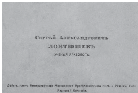
Посвідчення дійсного члена Імператорського археологічного інституту і Рязанської вченої архівної комісії

розділів науки — великий інтерес становлять його дослідження поселень доби бронзи, розкопки курганів (давніх могильників). Завдяки С.О. Локтюшеву науковий світ дізнався про унікальні матеріали палеолітичних стоянок біля с. Весела Гора (1919) та хутора Роголик — Роголик-Якимівська стоянка (1926). У 1937 р. за дорученням радянської секції Міжнародної асоціації з вивчення четвертинного періоду С.О. Локтю-