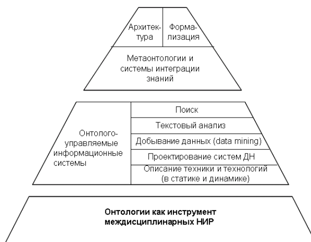
Рисунок 2 – Междисциплинарный характер онтологий в научных исследованиях

Перечень методологических проблем и нерешенных задач в области онтологий можно продолжить. Например, отсутствие приемлемого теоретического обоснования инструментальной реализации онтологических систем, поскольку большинство проектов в этой сфере поддерживаются традиционными технологиями программирования и Веб. Похожие проблемы характеризуют теоретические аспекты создания интеллектуальных мультиагентных и Веб-сервисных систем, ориентированных на семантический Интернет. Таким образом, обобщение большинства названных проблемных вопросов дает возможность выделить ключевую сущность, объединяющую разнообразные онтологии в области ИИ. Эта сущность материализуется в понятии базы знаний, которая с расширением интеллектуальных технологий в Интернете, трансформацией его в семантический Веб, приобретает в такой новой Сети универсальные выразительные возможности, овециваясь в онтологиях.