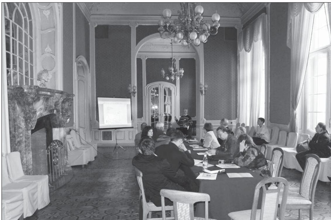
Пленарне засідання в Актівій залі Будинку вчених

міста-фортеці Тустань». Було представлено попередні результати по створенню електронного архітектурного архіву для фортеці Тустань, а також використані при цьому методи збору даних — наземне лазерне сканування, аерофотозйомка, геодезичні методи (GPS), елементи 3 D-ГІС та ін.