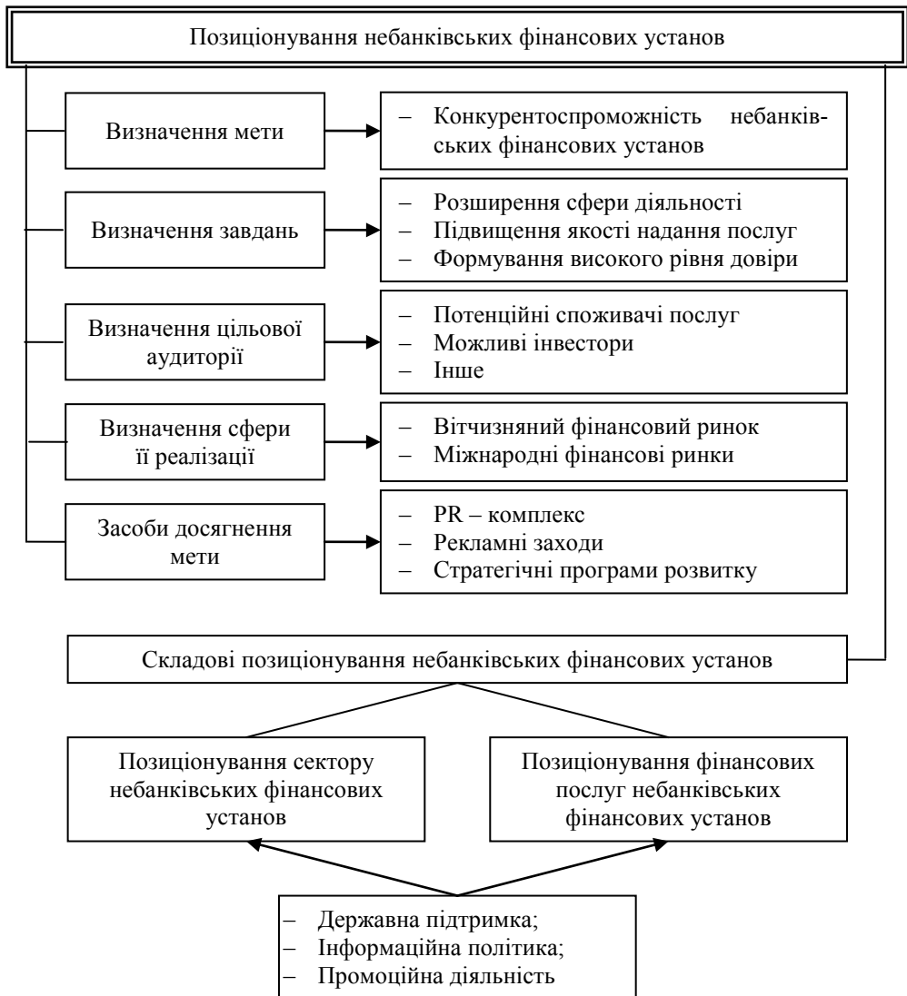
Рис. 3. Позиціонування небанківських фінансових установ на ринку фінансових послуг (Власна розробка автора_

Розв'язання проблеми формування довіри до небанківських фінансових установ потребує розроблення і реалізації спеціальної державної програми «Повернення довіри населення до фінансових установ», а з метою забезпечення позитивного іміджу та уникнення репутаційних ризиків небанківських фінансових установ необхідно створити багаторівневу систему управління реноме, включаючи до її складу профільні державні установи (насамперед Національний банк України, Міністерство фінансів, Держфінпослуг, ДКЦПФР та інших), окремі банківські та небанківські