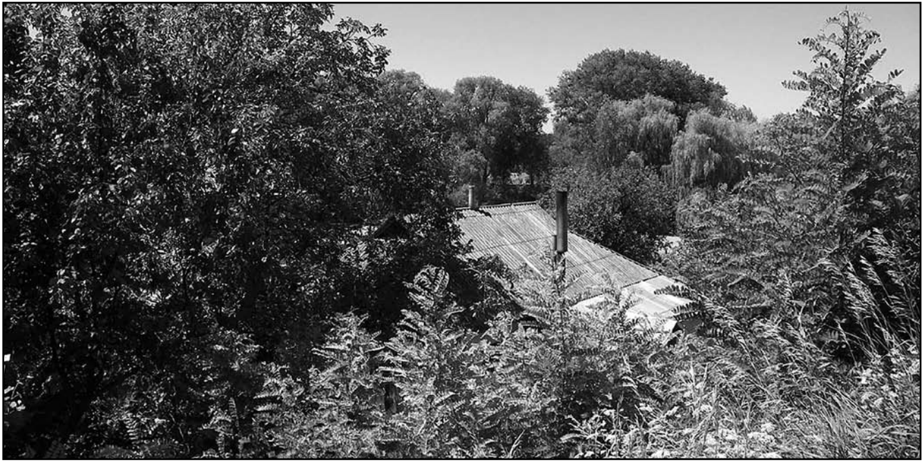
Видове розкриття історичного середмістя з Татарської гори

Для збереження характерних властивостей міського ландшафту Переяслава, композиційно-видових особливостей і панорамних характеристик історичної частини міста доцільно встановити зону охоронюваного ландшафту в межах: