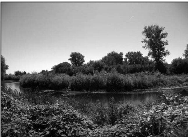
Видове розкриття р. Трубіж

Давня частина Переяслава зберегла своє природне оточення. Вона розташована в заплаві Трубежа, що охоплює її з двох боків і навесні перетворюється в широкий водний простір. Влітку це – величезні широкі луки. З протилежного місту боку долина Трубежа обмежена крутими схилами високого лівого берега.