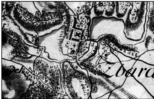
Карта 1. Фрагмент «Карти фон Міга» (Збараж)

На основі розгляду картографічної діяльності як