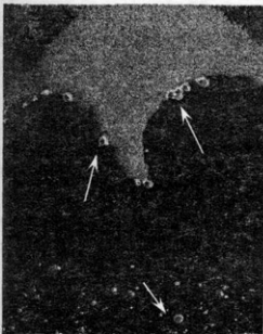
Рис. 3. Колонии бактерий на агаризованной среде Мюнца (2 % n-алканов, 10 % NaCl). Колонии окрашены в розово-красный цвет и расположены на поверхности застывшего парафина (указано стрелками).

Окраска выделенных бактерий была обусловлена двумя красными пигментами с различными спектральными характеристиками (рис. 3). Интенсивность накопления пигментов в клетках бактерий зависела от концентрации NaCl в среде культивирования: активность накопления пигментов в клетках бактерий была значительно выше на среде Мюнца с 10 %-м содержанием NaCl (см. таблицу). На средах с низким содержанием NaCl (среда Реймонда) клетки бактерий утрачивали пигментацию. Известно, что способность адаптироваться к высоким концентрациям солей положительно коррелирует с интенсивностью пигментации бактерий (Красильников, 1970). Можно полагать, что метаболизм пигментов вносит определенный вклад в процессы адаптации к высоким концентрациям NaCl в среде.