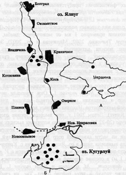
Рис. 1. Местонахождения (●) Chara uzbekistanica Hollerb. в Украине (А) и Придунайских озерах Ялпуг и Кугурлуй (Б).

с различной долей раковинного детрита. В районах положительных форм рельефа встречаются пески крупнозернистые, разнозернистые, карбонатные, сложенные раковинным детритом, изредка кварцевые (Сучков и др., 2002). Соленость данного водоема в 2000 г. составила 0,37-0,49 ‰, а в 2001 – 0,39-0,92 ‰, значение pH изменялось от 6,75 до 8,85 (Деньга, Мединец, 2002). Экологическая ситуация в исследуемых водоемах достаточно напряженная. Так, в 2001 г. из 18 измеряемых гидрохимических параметров регистрировалось их превышение по 7 в оз. Ялпуг и по 5 – в оз. Кугурлуй. Интегральным показателем трофического статуса водоемов рассматривают концентрацию хлорофилла “а” (Ковалева, Мединец, 2002). По этому параметру озера Кугурлуй и Ялпуг отнесены к мезотрофному типу, а северная половина последнего – к эвтрофному. Здесь наблюдается постоянный приток биогенов из внешних источников (сток р. Ялпуг и хозяйственно-бытовые стоки г. Болграда) (Сучков и др., 2002).