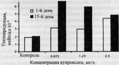
Рис. 3. Изменение теплопродукции Platyomonas viridis Rouch. под действием различных концентраций купроксата.