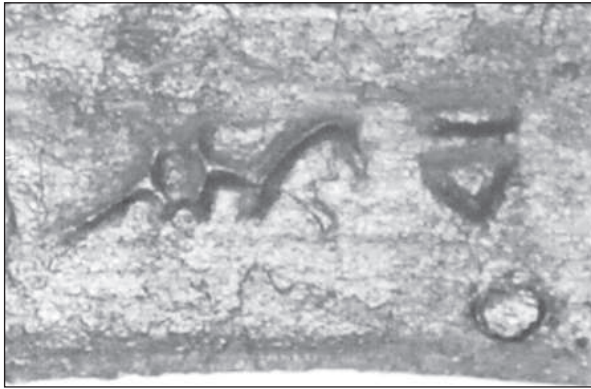
Рис. 2. Уроч. Сушки. Клеймо на ножі з обрисами дракона

с. Червоні (Хрещаті) Яри, уроч. Гайдамацький Яр, та ін. (рис. 1, 4) (Романюк 2003). Ножі, знайдені в уроч. Сушки, та зразок, оздоблений латунними вставками, з уроч. Липняки можна, найвірогідніше, віднести до одного хронологічного періоду, а саме литовської доби, — недостатньо вивченого, «темного» для півдня Київщини часу.