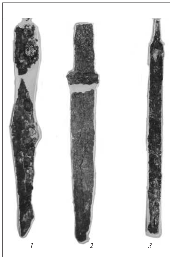
Рис. 2. Знахідки з Вищитарасівки (за: Шапошнікова, Бодянский, Шепинский 1957)

ти за такі знахідки окремих предметів латенських форм, які виявлені випадково або в складі комплексів місцевих культур. У причорноморському регіоні відомі випадки наявності середньолатенських мечів у складі інвентарю поховальних комплексів, які принаймні гіпотетично належали автохтонному населенню. Так, біля с. Паволче у Північно-Західній Болгарії кельтський меч у декорованих піхвах періоду LT C1 виявлений у підкурганному тілоспаленні разом із речами фракійського походження. Припускають, що меч міг належати фракійському воїнові з племені трибаллів або, що менше ймовірно, кельтові, похованому згідно місцевого обряду (Theodossiev 2005, р. 89—90). Ще один середньолатенський меч разом із македонським шоломом типу Пілос походить з ґрунтового поховання на північній околиці м. Казанлик (Emilov 2010, р. 76—77). Кілька середньолатенських мечів виявлено також у воїнських похованнях могильника Кальново у Північно-Східній Болгарії поряд із іншими предметами побуту, воїнського та кінського спорядження латенського та елліністичного кола (Emilov 2007, р. 65—66). Знахідки військового спорядження середньолатенських типів (насам-