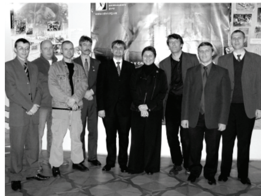
Делегація ЦДГРЛ разом з працівниками ЦДВР

У березні 2006 р. науковці ЦДВР зав'язали цікаву співпрацю зі словацькими дослідниками. 16 березня в Університеті Матея Бели в Банській Бистриці відбулася конференція «УПА в історії післявоєнної Чехословаччини 1945–1947 рр.», у якій взяв участь представник ЦДВР. За результатами конференції готується збірник статей. Важливо, що співпраця зі словацькими колегами не припинилася після цієї конференції. Основа для її продовження – велике зацікавлення діяльністю УПА з боку істориків Словаччини – тут, зокрема, є ціла група дослідників, які займаються цією темою. В ході зустрічей з ними вирішено створити спільну наукову працю про діяльність УПА та українського підпілля. До реалізації проекту планується залучити також чеських і польських дослідників.