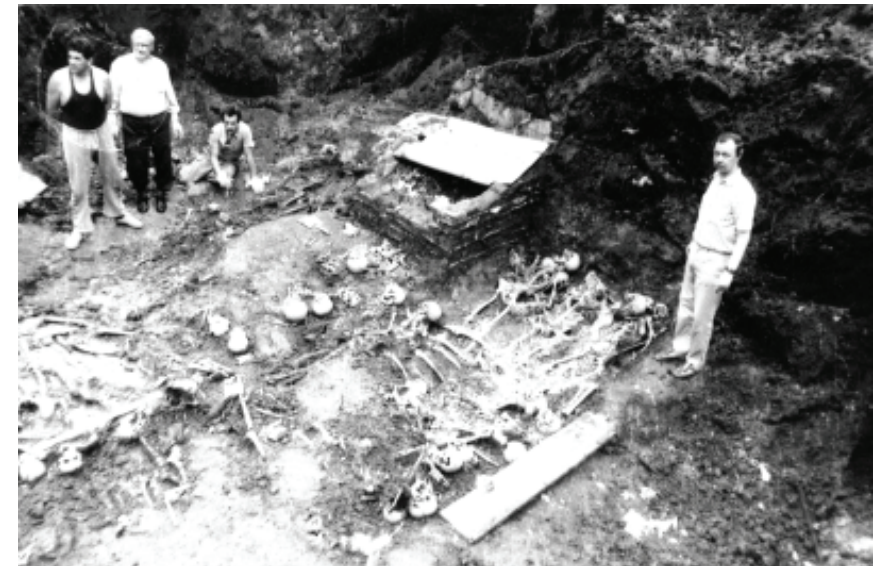
Екзумація жертв НКВС 1941 р. на подвір'ї в'язниці № 2 (Замарстинівської), м. Львів. 1991 р.

Енкаведисти наперед запроторили мене до тюрми на Замарстинові, опісля перевезено до тюрми на Лонцького з метою там мене зламати фізично і духовно. Слідчі примінювали до мене різні фізичні і психічні тортури, а все-таки не вдалося їм мене зламати. Сказали: “Ми тебе будемо тримати 10 років, не дамо тобі жити ані вмерти, будемо з тебе тягнути кишку за кишкою, ми не польська поліція, де ти до нічого не признався, ти нам скажеш все, що знаєш, і то, чого не знаєш”. Це мене не настрашило, навпаки, потішило. Я сподівався, що мене не розстріляють, а до 10 років всяке може статися.