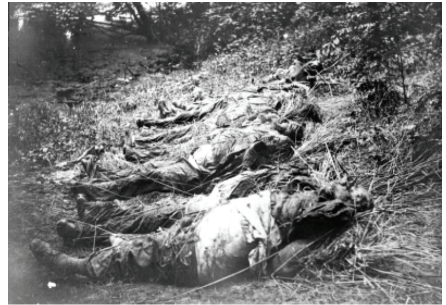
Замордовані українські патріоти в урочищі Закладів біля м. Миколаєва Львівської обл. Червень 1941 р.

По состоянию на 22/VI – в тюрьме г. Тарнополь содержалось 1790 чел. заключенных. Из этого количества 500 чел. убыло по 1-й категории.