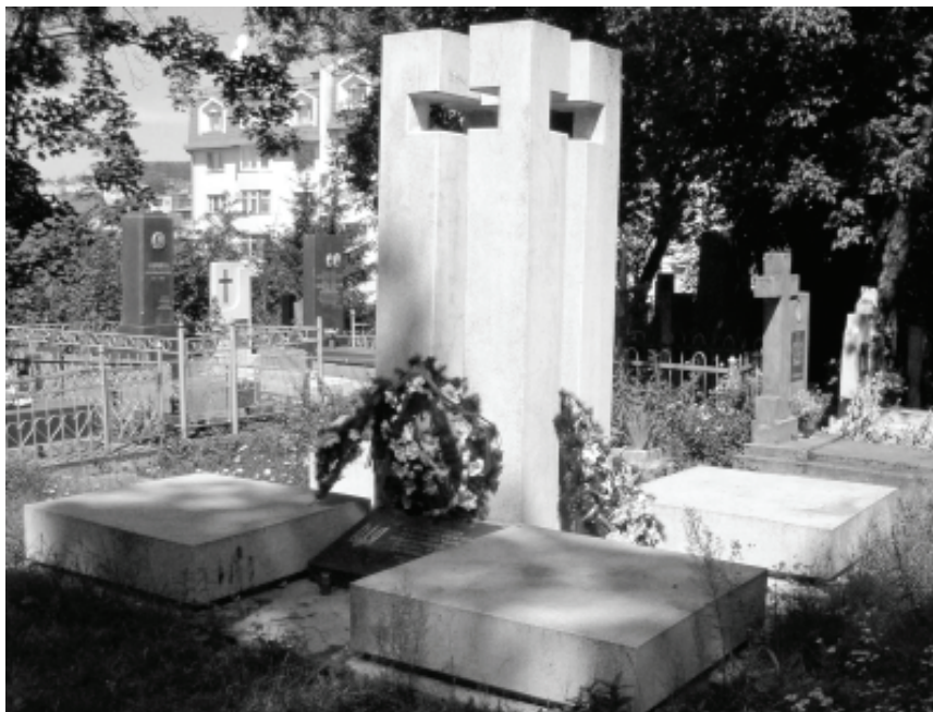
Одна з масових могил жертв НКВД 1941 р. на Личаківському кладовищі, м. Львів.