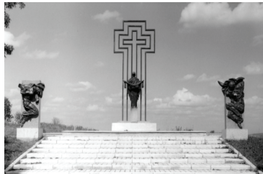
Меморіальний комплекс на масовому похованні в м. Жидачів Львівської обл.