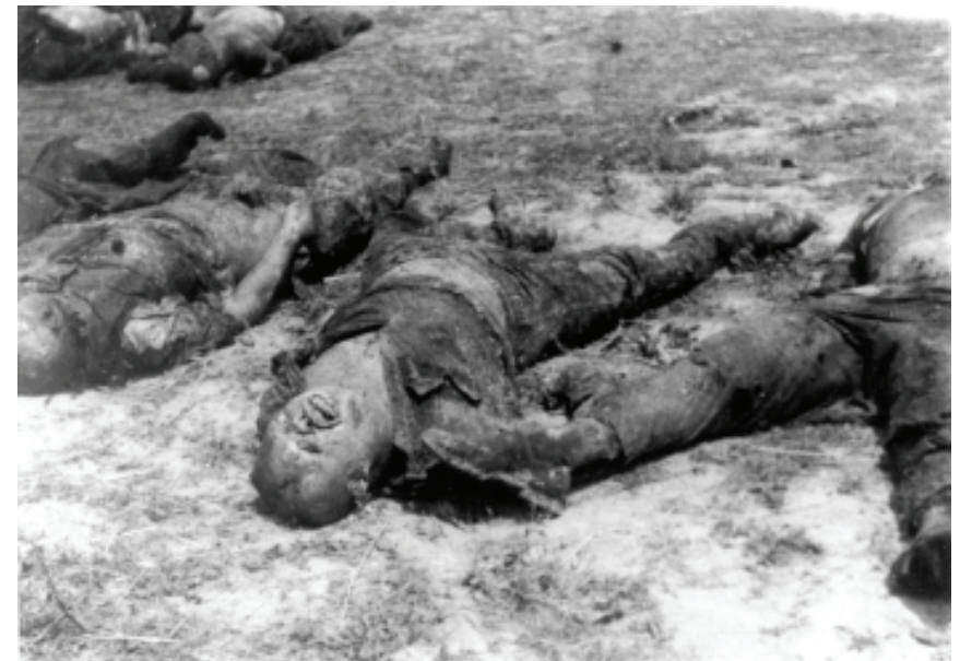
Жертви в'язниці № 3, м. Золочів, червень 1941 р.

5. «Доношу, что в тюрьме г. Бережаны Тернопольской обл. осталось 48 з/к, не преданных земле, 20 трупов остались в подвале