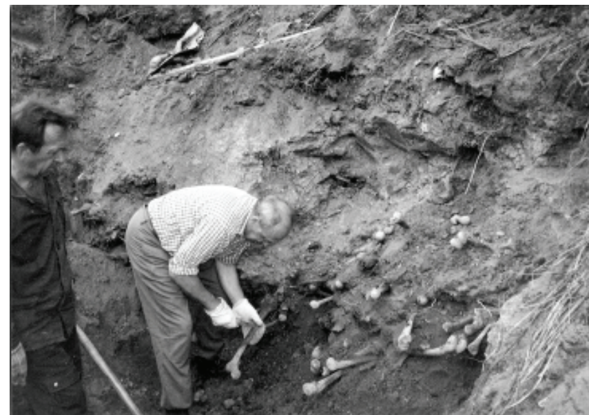
Дослідження масового поховання у м. Володимирі-Волинському. 1997 р

Камера в кінці коридору мала ще одні двері зліва. Те інше приміщення було засипане ґрунтом та уламками цементного покриття, здертого у попередньому. На весь обсяг першого була викопана яма, завалена трупами. Згори їх присипано тонким шаром