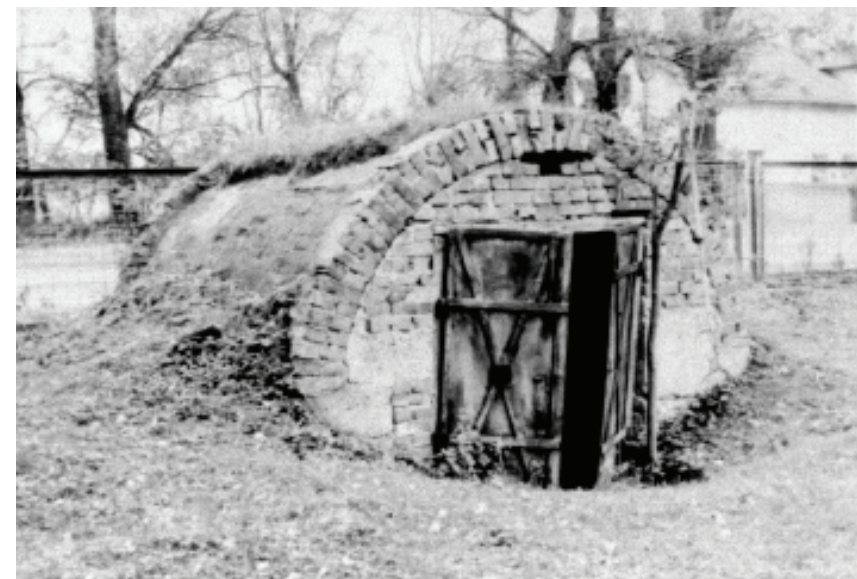
Льох-катівня УНКВС у м. Бурштині Івано-Франківської обл.

Червоні кати з наганами в руках бігали то тут то там, кричали і видавали накази. Чуємо наказ: “Відвернутись спиною до вікон