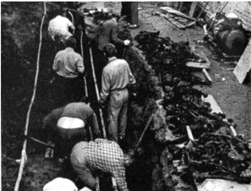
Розкопки жертв 1941 р. на подвір'ї УНКВД у м. Дрогобичі. 1992 р.

Тюрьму гор. Луцк совместно с командиром роты конвойных войск ст. лейтенантом Фахурдиновым и всем составом работников тюрьмы г. Луцк мы оставили после утери связи с УНКВД воинскими частями 25.06.41 г. в 23 часа 30 мин.