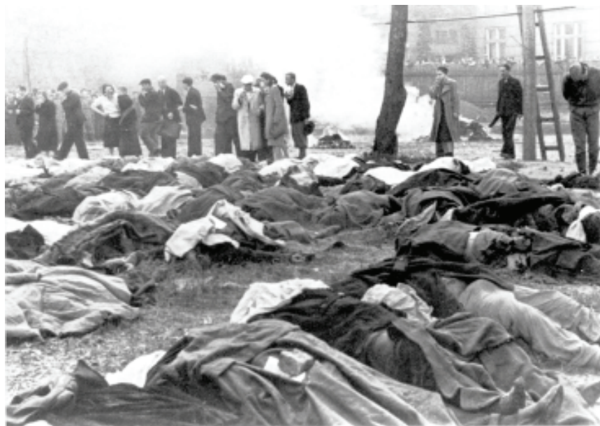
Тіла замордованих, розкладені для упізнання на подвір'ї в'язниці № 1 (по вул. Лонцького), м. Львів. Червень 1941 р

Багаторічні дослідження різних джерел, як-то архівних документів, повідомлень у пресі того періоду, свідчень очевидців та родин загиблих, зібраних істориками, краєзнавцями та громадськими організаціями, дали можливість встановити загальне число