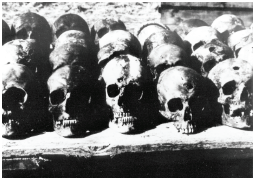
Жертви НКВД, ексгумовані в Дем'яновому Лазі, м. Івано-Франківськ. 1990 р.