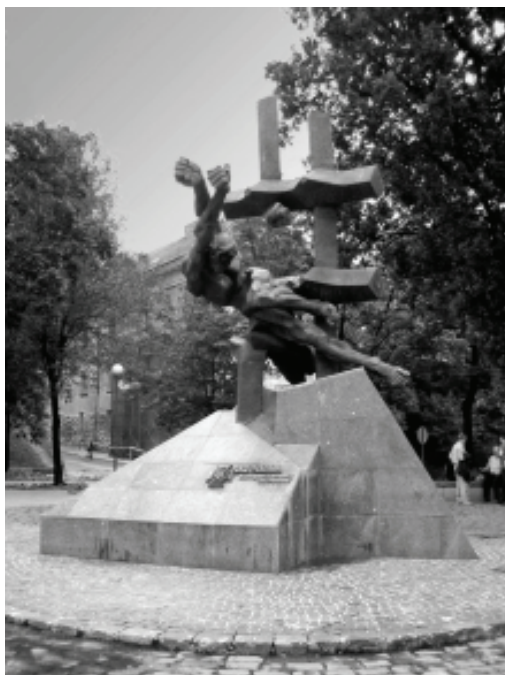
Пам'ятник жертвам більшовицького режиму навпроти в'язниці № 1 – на пл. М. Шашкевича, м. Львів

горілчану передишку в себе, бо жодних кроків не було чути. На моїх ногах лежав ще хтось. Визволившись з-під трупів, я на пальцях, уважно наслуховаючи, вийшов коридором аж на подвір'я. Двері туди були відчинені. Я вмить видряпався біля сусіднього стовпа на паркан, незважаючи на те, що руки собі подер до колючого дроту. Відразу перескочив на другий бік. Недалеко починалося кукурудзяне поле. Околицю я знав ще з польських часів. Тут я почув, як на подвір'ї тюрми піднявся крик: «Стої! Стої!» І чути було постріли. Але я вже був вільний».