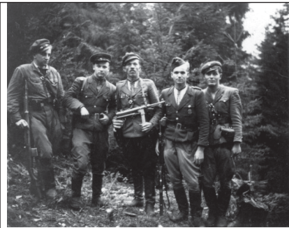
4. Група повстанців. Фото "Липкевича". Світлина №111 з Яворівського архіву УПА.