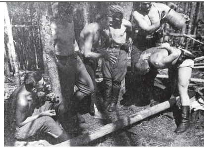
5. Повстанська "лазня". Фото "Липкевича". Світлина №119 з Яворівського архіву УПА.

успішного висліді бою була старанно проведена розвідка, яку здійснила група "Липкевича".