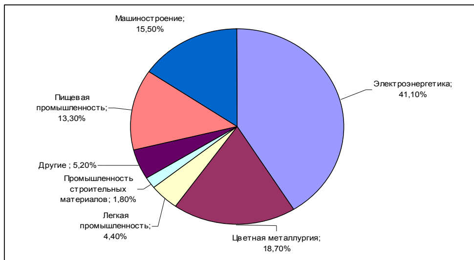
Рис. 3 Структурная схема распределения труда в промышленном комплексе Николаевской области (по данным [12])

Машиностроительная отрасль г. Николаева и области представлены Научно-производственным комплексом газотурбиностроения «Зоря-Машпроект» (более 93 % соответствующей продукции Украины); ОАО Первомайский завод «Дизельмаш» (дизели, дизель-генераторы, дизель-газогенераторы); ОАО «Первомайский завод «Фрегат» (дождевальные машины); Николаевский завод смазочного и фильтрующего оборудования; завод «Дормашина» (асфальтоукладчики); предприятия электротехнической и электронной промышленности («Ингул», «Факон», «Эдма» и др.).