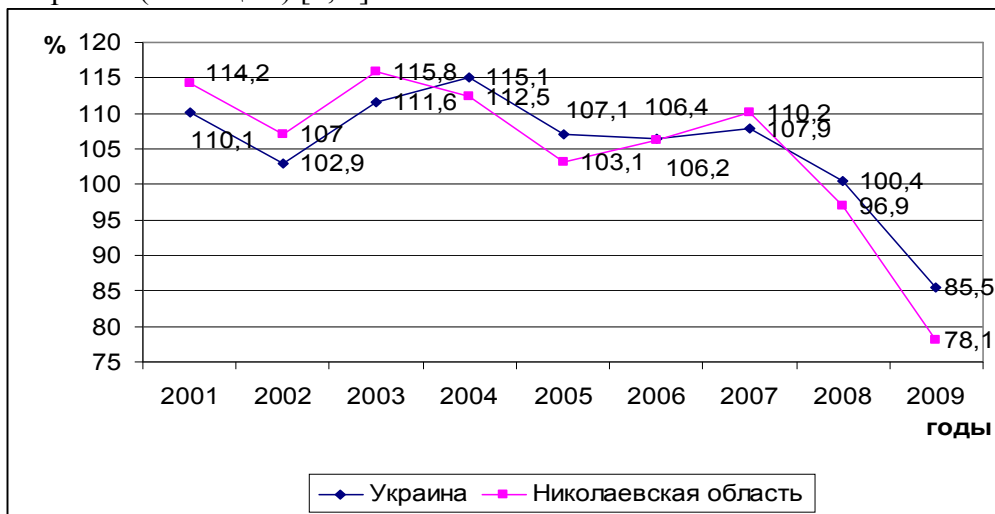
Рис. 4 Сравнительный анализ индексов промышленной продукции Николаевской области и Украины за период с 2001 по 2009 гг. (по данным [8])

Агропромышленный потенциал. Сельское хозяйство – вторая по объемам и первая по занятости трудовых ресурсов отрасль материального производства Николаевской области, площадь сельхозугодий области которой более 2 млн. га, в т.ч. 85 % - пашни (более 5 % площадей пахотных земель Украины); 13,7 % - пастбища и сенокосы; 2 % - плодово-ягодные насаждения. На одного жителя области приходится почти 1,3 га пашни, т.е. в 2 раза больше, чем в среднем по Украине; а на одного работника, занятого в системе сельскохозяйственной деятельности – более 11 га пахотных земель, что является одним из самых высоких показателей в Украине (таблица 1) [3, 8].