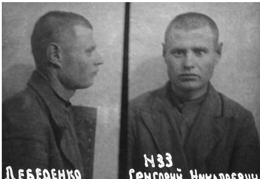
Григорій Лебеденко, 1941 р.