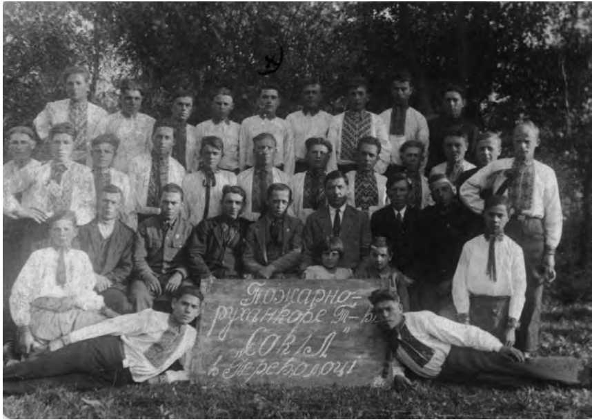
Члени товариства «Сокіл», 1934 р.

начальником УНКГБ по Запорізькій області старшим лейтенантом держбезпеки Леоновим. На 5 аркушах машинопису коротко викладено умови, за яких виник гурток «Самостійна Україна», опис співбесід і вербування нових учасників, проведення антирадянської агітації тощо. Всі п'ятеро заарештованих на слідстві себе визнали винними 21 .