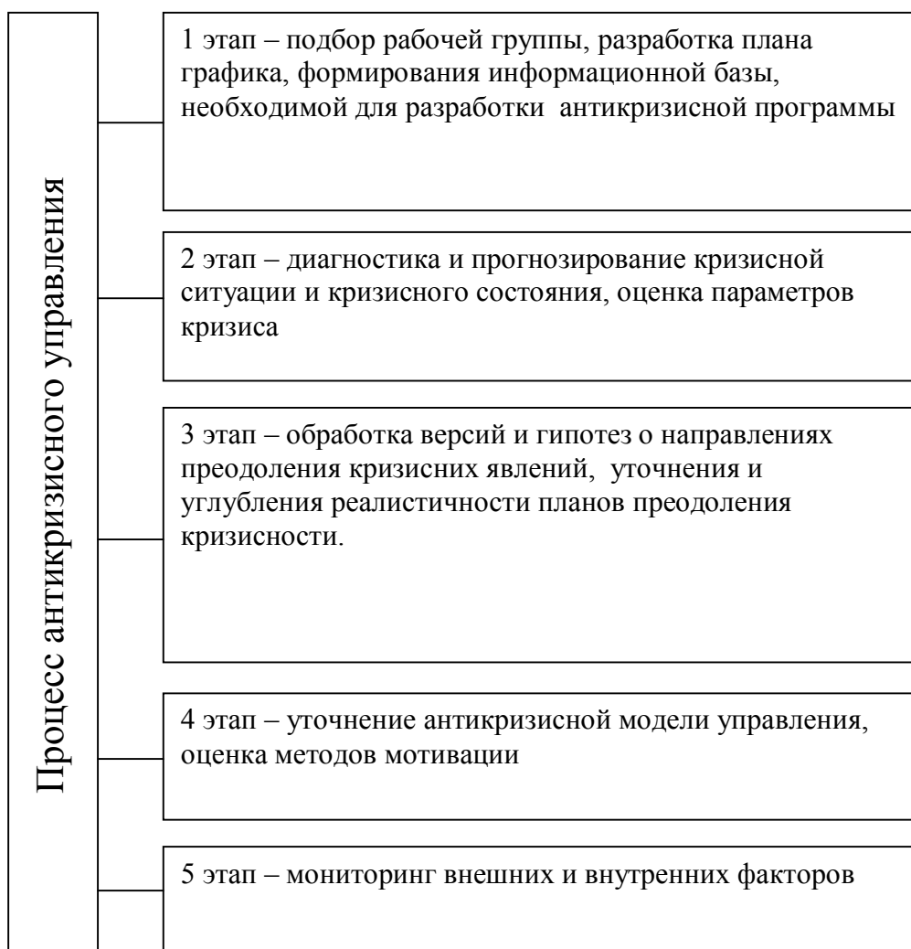
Рис. 1. Процесс антикризисного управления регионом

5 этап — мониторинг внешних и внутренних факторов, которые влияют на экономико-экологическое состояние развития региона.