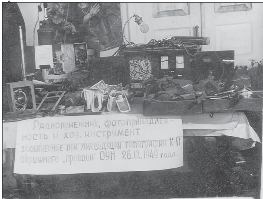
Вилучене майно друкарні Кам'янець-Подільського проводу ОУН, 1944 р.

селах та районах. Донесення ген.-май. Сергію Горшкову містить інформацію про те, що у березні 1945 р. на території Козівського, Бережанського, Підгасцького р-нів силами 187, 221 та 222 батальйонів внутрішніх військ НКВД та новоствореної спецгрупи на чолі з колишнім комендантом боївки СБ окружного проводу Миколою Глинським-‘Бистрим’ проводилась велика чекістсько-військова операція, вістря якої спрямовувалось на сс. Конюхи, Бишки, Вибудів, Ценів з метою виявлення керівництва ОУН, що прибуло на «міжкрайовий з'їзд» 4 . Але ніхто з оунівського керівництва на той час не загинув, до рук співробітників НКВД та НКГБ потрапили лише окремі охоронці та зв'язкові.