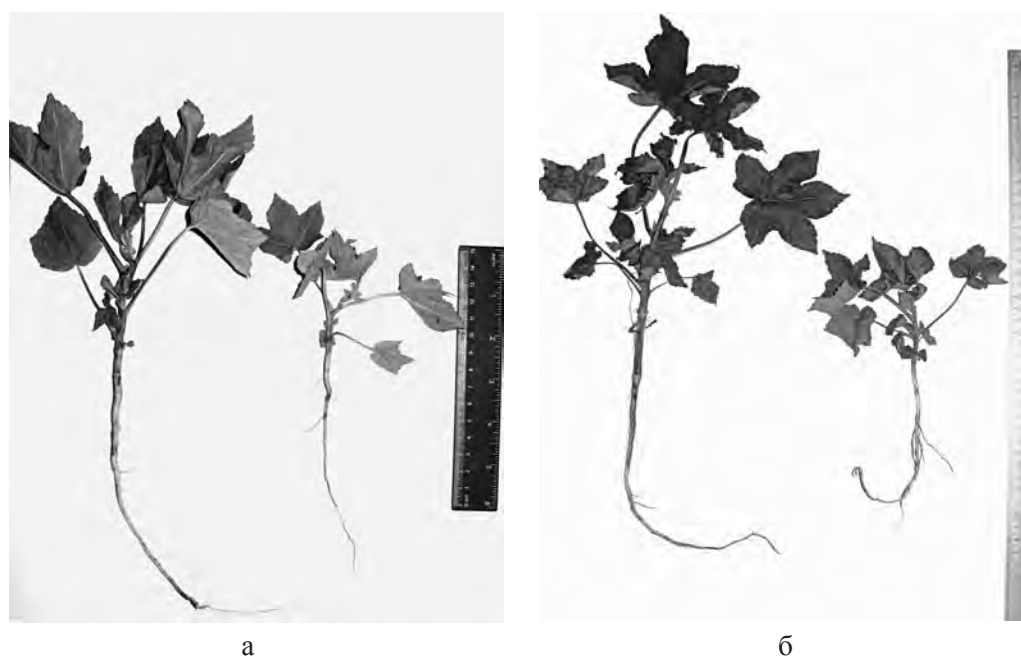
Рис. 3. Hibiscus manihot L. :

* Примітка: М ± m – середнє арифметичне та похибка середнього арифметичного