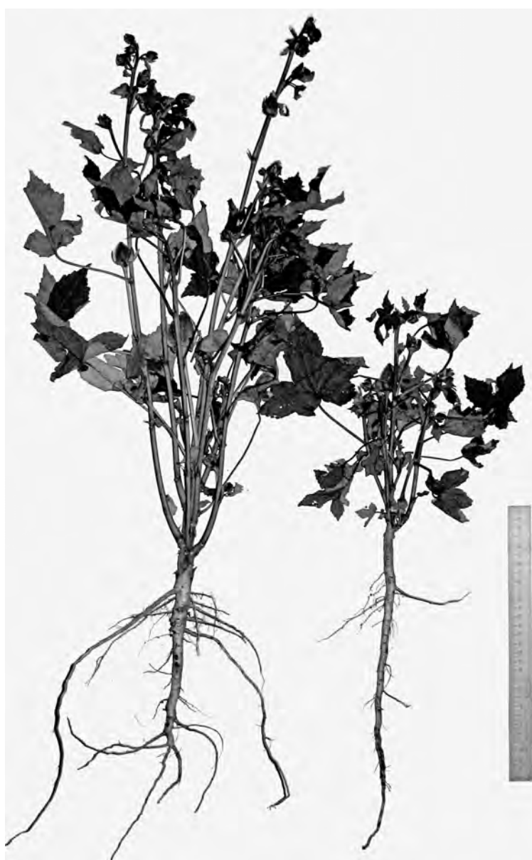
Рис. 4. Hibiscus manihot L.: рослини молодого генеративного стану: праворуч – контроль, ліворуч – рослини, оброблені 10 мг/л ІОК

Висота рослини сягає 28,5 \pm 0,5 см, довжина кореня 35,5 \pm 0,5 см, діаметр стебла 0,8 \pm 0,01 см. Початок цвітіння та плодоносіння припадає на 110 \pm 3 день після сівби насіння в контрольному варіанті та на 78 \pm 3 день в дослідному варіанті. У молодих генеративних рослин у фазі початку цвітіння, плодоносіння в дослідному варіанті відмічено збільшення висоти рослини в 2 рази, діаметра стебла в 1,8 рази, довжини кореня в 1,9 рази, кількості бічних коренів в 1,5 рази, довжини бічних пагонів в 2,5 рази порівняно з контролем (див. табл., рис.4). Тривалість молодого генеративного стану становить 40 \pm 3 днів. Середній генеративний стан . Рослини з 12-а – 15-а справжніми листками у фазі цвітіння і плодоносіння, початку дозрівання насіння. Висота рослини сягає 57,5 \pm 0,5 см, довжина кореня 19,5 \pm 0,5 см та діаметр стебла 1,2 \pm 0,05 см. Стебло при основі і корінь стають здерев'янілими. Рослини досягають найбільшої потужності. Початок дозрівання насіння в контрольному варіанті припадає на 95 \pm 3 день, в дослідному варіанті – на 85 \pm 3 день. Тривалість середнього генеративного стану складає 40 \pm 3 днів. Для рослин середнього генеративного стану з насіння обробленого 10 мг/л ІОК, відмічено збільшення висоти рослини в 1,5 рази, діаметру стебла в 1,4 рази, довжини кореня в 1,5 рази, кількості бічних коренів в 1,7 рази, довжини бічних пагонів в 2,5 рази порівняно з контролем (див. табл., рис. 5).