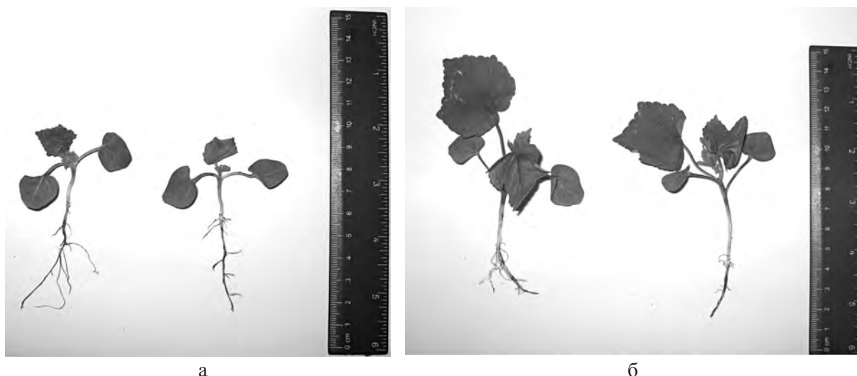
Рис. 2. Hibiscus manihot L. : рослини ювенільного стану: а – рослина з двома справжніми листками, б – рослина з трьома справжніми листками; праворуч – контроль, ліворуч – рослини, оброблені 10 мг/л ІОК

Один сім'ядольний листок еліпсоїдної форми має довжину 1,5 \pm 0,2 см, ширину 1,7 \pm 0,2 см, довжина черешка – 1,9 \pm 0,2 см та другий – серцеподібної форми довжиною 1,5 \pm 0,2 см, шириною 2 \pm 0,2 см, довжина черешка – 1,3 \pm 0,2 см. Перший справжній листок, на відміну від листків дорослих рослин, яйцеподібний (довжина 3,5 \pm 0,2 см, ширина 2,3 \pm 0,2 см, довжина черешка – 1,2 \pm 0,2 см), другий справжній листок п'ятикутний (довжина 4,8 \pm 0,3 см, ширина 7,3 \pm 0,3 см, довжина черешка – 4,5 \pm 0,2 см). Висота рослини в період цього вікового стану складає 6,3 \pm 0,5 см, довжина кореня – 5,3 \pm 0,5 см та діаметр стебла – 0,2 \pm 0,05 см.