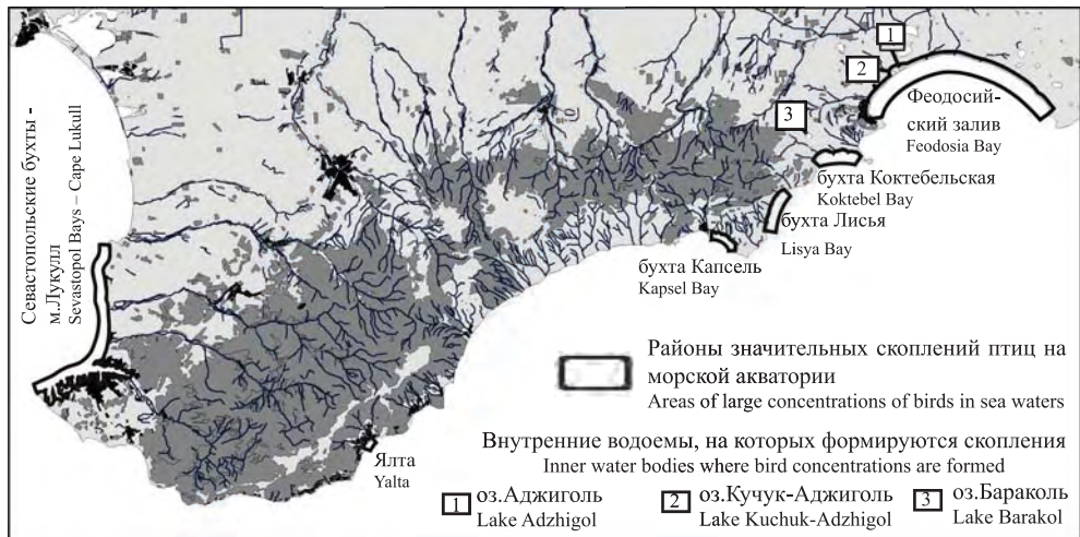
Рис. 4. Береговые зоны и акватории южного Крыма, важные как временные резерваты для птиц в периоды экстремальных похолоданий.

Районы Южного Крыма, важные для временного пребывания зимующих птиц при экстремальных похолоданиях, показаны на рис. 4