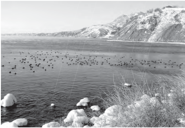
Рис. 3. Зимнее скопление птиц на морской акватории во время похолодания в январе 2006 г. (окрестности п. Курортное).

1. Морская акватория. Наличие незамерзающей даже в суровые зимы прибрежной акватории моря (рис. 3) является главным фактором, определяющим роль южного Крыма, как района вынужденных зимовок при экстремальных похолоданиях. На ней формируется наиболее разнообразный в видовом отношении и самый многочисленный зимний орнитокомплекс. В периоды похолоданий акватория служит временным биотопом не менее чем для 28 видов птиц (табл. 1).