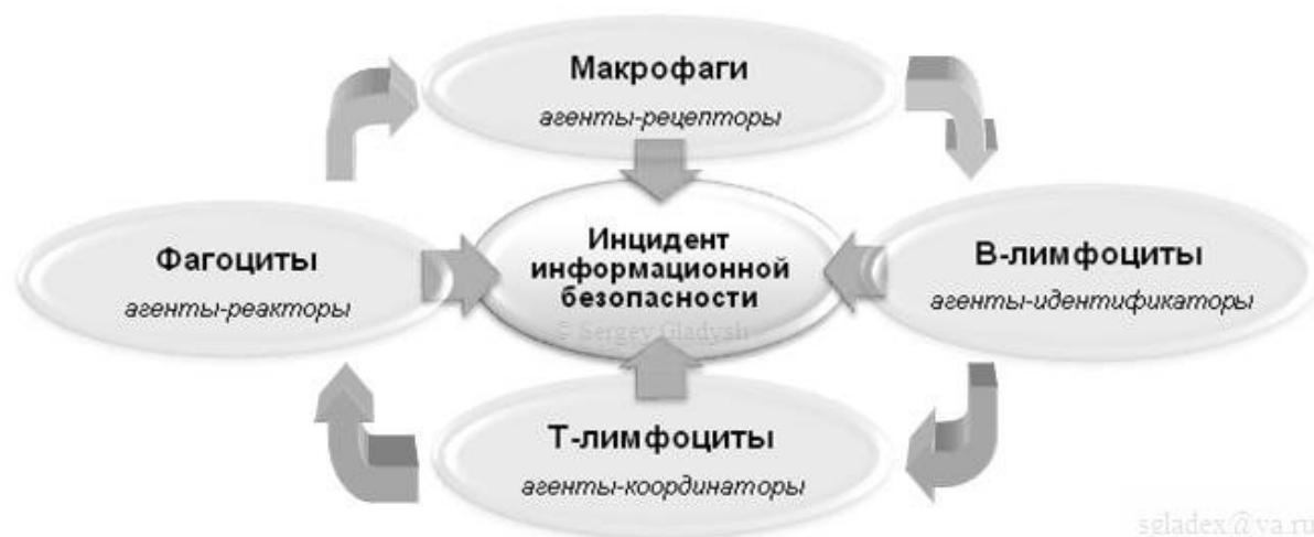
Рисунок 2 – Цикл и функции управления инцидентами посредством ИИС

Будем проектировать данную систему, используя иммуно-мультиагентную технологию [19]. Рассмотрим 4 класса агентов (рис. 2): агенты-детекторы; агенты-идентификаторы; агенты-координаторы; агенты-реакторы.