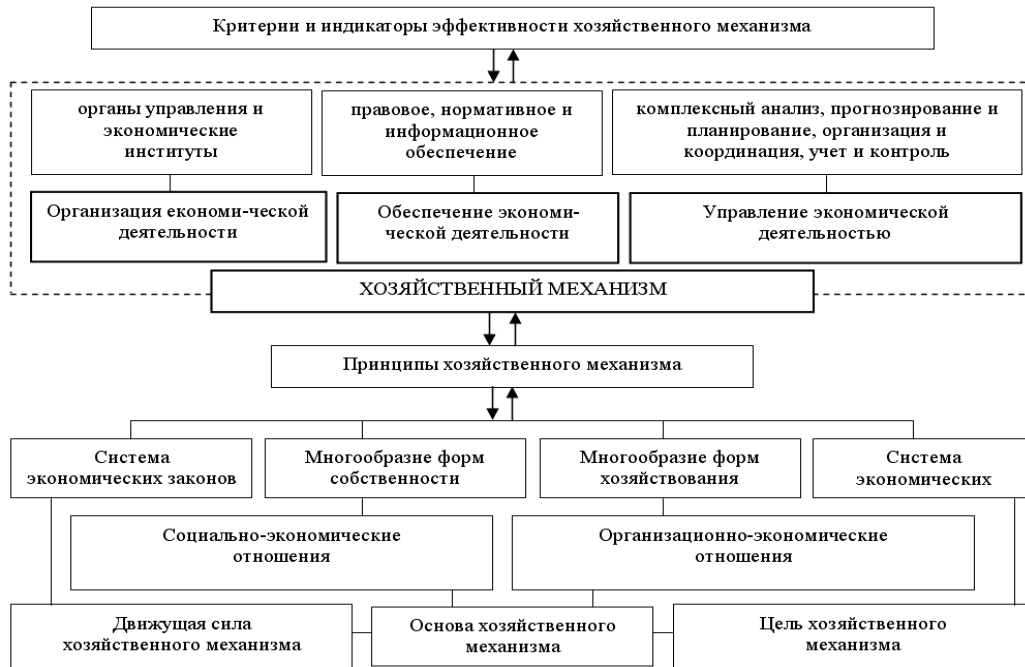
Рис. 1. Организационная структура хозяйственного механизма СЭС (разработка автора).

В рыночной экономике влияние хозяйственного механизма на различные аспекты развития СЭС проявляется количественно и качественно. Количественно влияние хозяйственного механизма определяется суммой экономических ресурсов, аккумулируемых и выделяемых на различные цели, а качественно – в способах формирования экономических ресурсов, каналах и формах их движения, условиях выделения. Именно качественные аспекты развития хозяйственного механизма обуславливают его внутреннюю структуру, включающую две подсистемы – ресурсное обеспечение и экономическое регулирование (рис. 2).