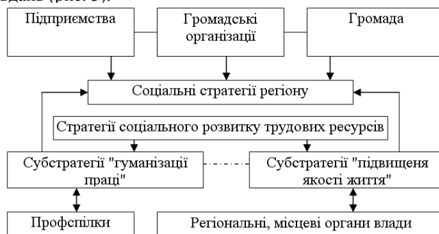
Рис. 3. Система соціальних стратегій регіону.

Вцілому, соціальна стратегія регіону є цілісною системою субстратегій, спрямованих на вирішення всього комплексу його завдань (рис. 3).