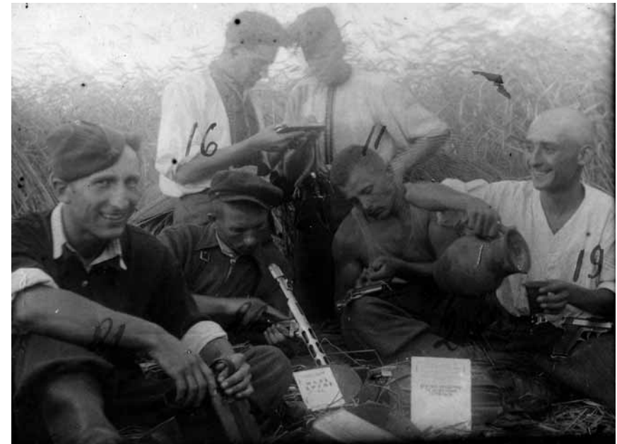
Підпільники з Кам'янець-Подільського окружного проводу ОУН