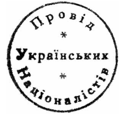
Печатка Проводу Українських Націоналістів. 1929 р.

У липні 1927 р. Д. Андрієвський підготував перелік тем доповідей і доповідачів на майбутній конференції та переслав його Є. Коновальцю, котрий схвалив пропозиції. Постало питання критеріїв добору делегатів. Є. Коновалець писав Д. Андрієвському: «[...] треба би нам порозумітися, кого саме будемо притягати до участі в конгресі, а іменню, чи будемо запрошувати на нього індивідуально поодиноких людей чи може представників певних організацій» 9 . Д. Андрієвський як голова підготовчого комітету підкреслив: «[...] треба змагати, щоби то був справжній Конгрес Українських Націоналістів» 10 . Водночас він вважав, що участь у конгресі мають узяти не лише емігранти, а обов'язково й делегати крайових організацій з Галичини, Волині, Прикарпаття, Буковини та Наддніпрянщини, хотів він також бачити представників зі США й Канади. Є. Коновалець особливо наголошував на широкому представництві українських земель, щоб конгрес набув загальноукраїнського, а не емігрантського характеру. Труднощі з делегатами від галицьких націоналістів, на думку Д. Андрієвського, не мали б перешкодити проведенню конгресу; він наполягав на тому, що «навіть коли б з краю ніхто б не приїхав, нам не можна кидати справу. Навпаки, приступити негайно до практичних заходів до організації як Конференції» 11 . Тут