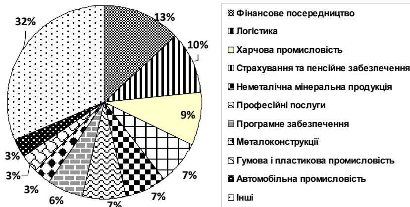
Рис. 1. Галузева структура ПІІ в економіку України за 2006-2010 рр. [1].

В економіку України у 2011 р. іноземними інвесторами вкладено 6473,1 млн дол. США прямих інвестицій, а обсяг інвестицій із початку інвестування на 1.01.2012 р. становив 49362,3 млн дол. США, що на 10,2 % більше обсягів інвестицій на початок 2011 р., та в розрахунку на одну особу - 1084,3 дол. Інвестиції надійшли зі 128 країн світу. Щодо секторального розподілу іноземних інвестицій, Україна посідає третє місце серед країн Центральної та Східної Європи за вкладеннями інвестицій у сферу фінансових послуг, 10 % від загальної кількості інвестиційних проектів у нашій країні - це логістичні проекти та 9 % спрямовані у виробництво продуктів харчування (рис. 1).