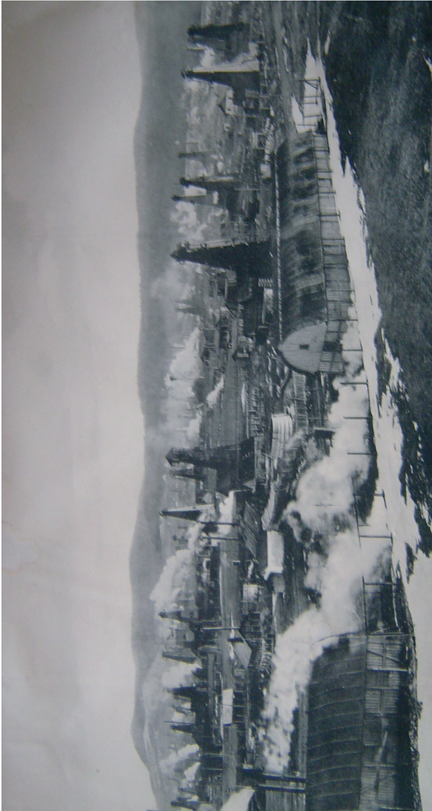
Рис. 1. Панорама Бориславського нафтопромислу, кінець XIX ст.