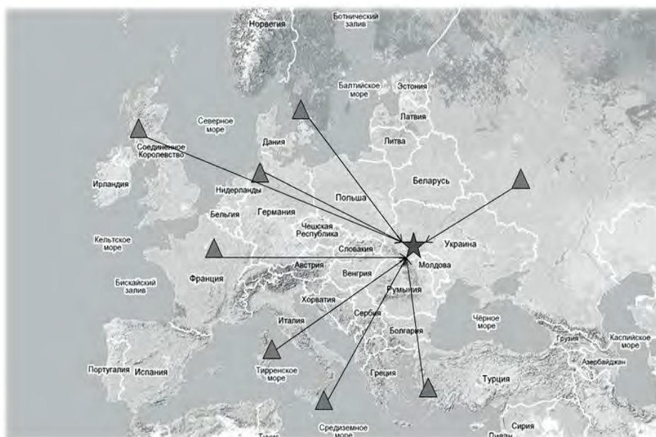
Рис.2. Схема размещения СДВ радиостанций и распространения радиотрасс от излучателей до пункта наблюдения «Каменец-Подольский»