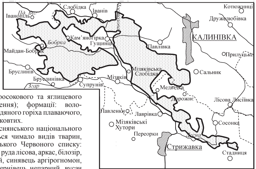
Рисунок 2. Буго-Деснянське національне природне ядро

дубового лісу волосистоосокового та яглицевого (старі типи насаджень); формації: волосистоосоково-гіпнова, водяного горіха плаваючого, латаття білого, глечиків жовтих.