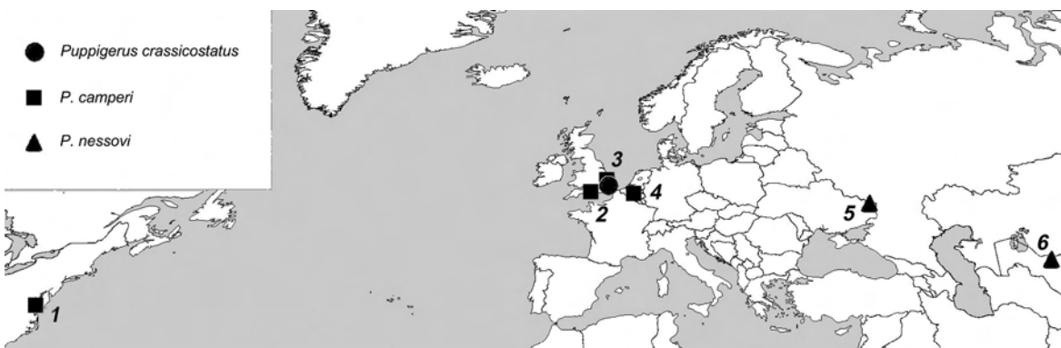
Рис. 3. Местонахождения (и местные стратоты) черепах рода Puppigerus : 1. Потапакская пачка, ранний эоцен. 2. Брэкслхемские и бартонские слои, средний эоцен. 3. Лондонские глины, ранний эоцен. 4. Брюссельские и веммельские пески, средний эоцен. 5. Иково, средний эоцен. 6. Джерой 2, средний эоцен

3. Близким к P. nessovi видом был P. camperi , который впервые в геологической летописи появляется в низах ипре США (потапакская пачка) и Великобритании (лондонские глины) [20, 23]. Из нижнеипрских отложений Казахстана (Джилга 1б, Джилга 2) известны массовые материалы Tasbacka aldabergeni при отсутствии материалов Puppigerus [5]. Это может свидетельствовать о более позднем появлении P. nessovi , чем P. camperi , или о более позд-