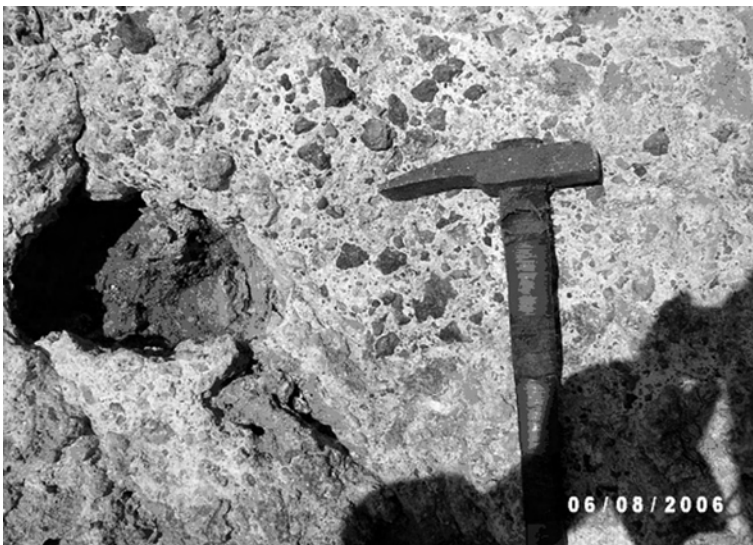
Рис. 4. Гераклиты угловатой и рвано-оскольчатой формы в брекчиевидных известняках. Буро-коричневые "стяжения" угловато-округлой формы, выполненные лимонитом и гидроокислами железа (возможно, фрагменты выветривания пиритовых построек неогена). Мыс Херсонес

24]. Анализы газового состава выбросов грязевых вулканов суши часто содержат сероводород. Академик Е.Ф. Шнюков выдвинул гипотезу, что подпитка и образование сероводородной зоны в Черном море связаны с деятельностью грязевого вулканизма и сипов [24]. Глубинное происхождение сероводорода, послужившего причиной заражения моря, подтверждается его наличием во многих источниках Горного Крыма и в скважинах для водоснабжения, пробуренных в зонах разломов. Анализ воды из них характеризуется высокими содержаниями сероводорода, йода, брома и кремнезема. Породы водоносного горизонта и ниже залегающих слоев не содержат органики, а