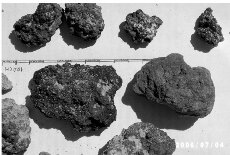
Рис. 2. Шлаковидный облик гераклитов серовато-черного цвета

литами в толще неогеновых пород Юго-западного Крыма явились основанием для постановки опытных работ по изучению газового состава флюидов из них.