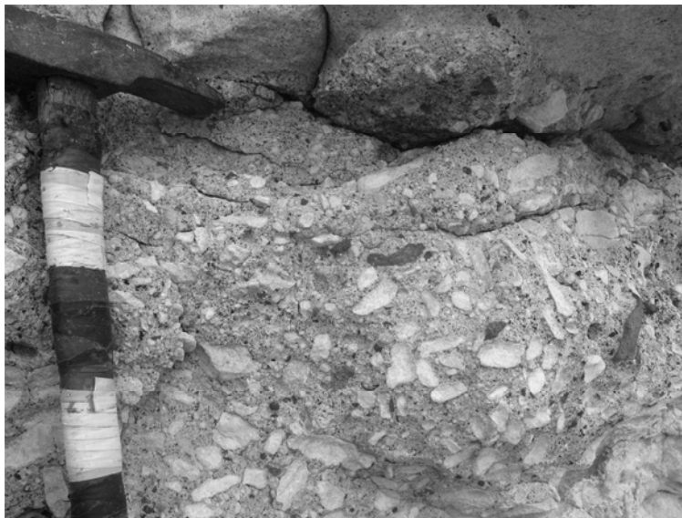
Рис. 1. Брекчиевидный известняк верхнего сармата с обломочным материалом гераклитов

При ударе и трении двух образцов гераклитов друг о друга появляется специфический запах углеводородов и битумов. Необходимо отметить, что при истирании мелкообломочного материала в порошок этот запах резко усиливается. Поровое пространство в гераклитах, согласно нашим исследованиям, заполнено метаном, углекислым газом, этаном, пропаном, азотом и сероводородом [14]. Эти газы являются прямыми признаками для поиска газонефтяных месторождений и подтверждают процессы глубокой дегазации в неогене. Эти данные и широкое распространение прослоев пород с герак-