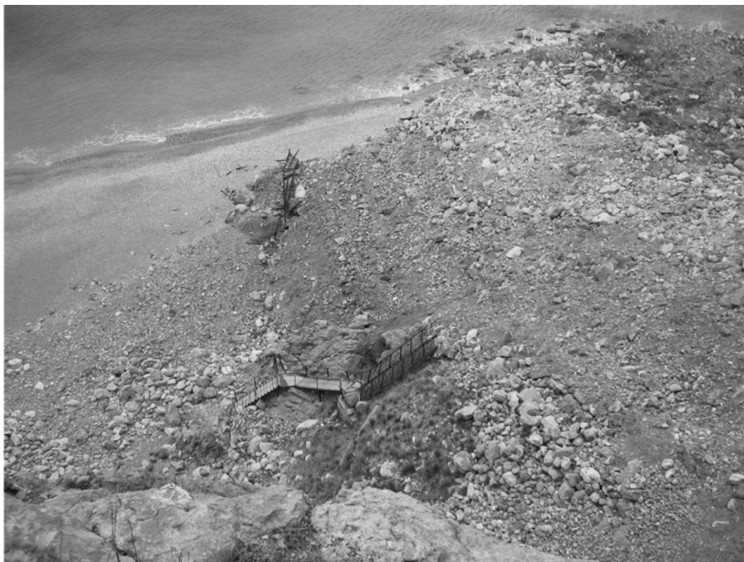
Рис. 3. Языковая часть оползня № 1648 после его катастрофической активизации