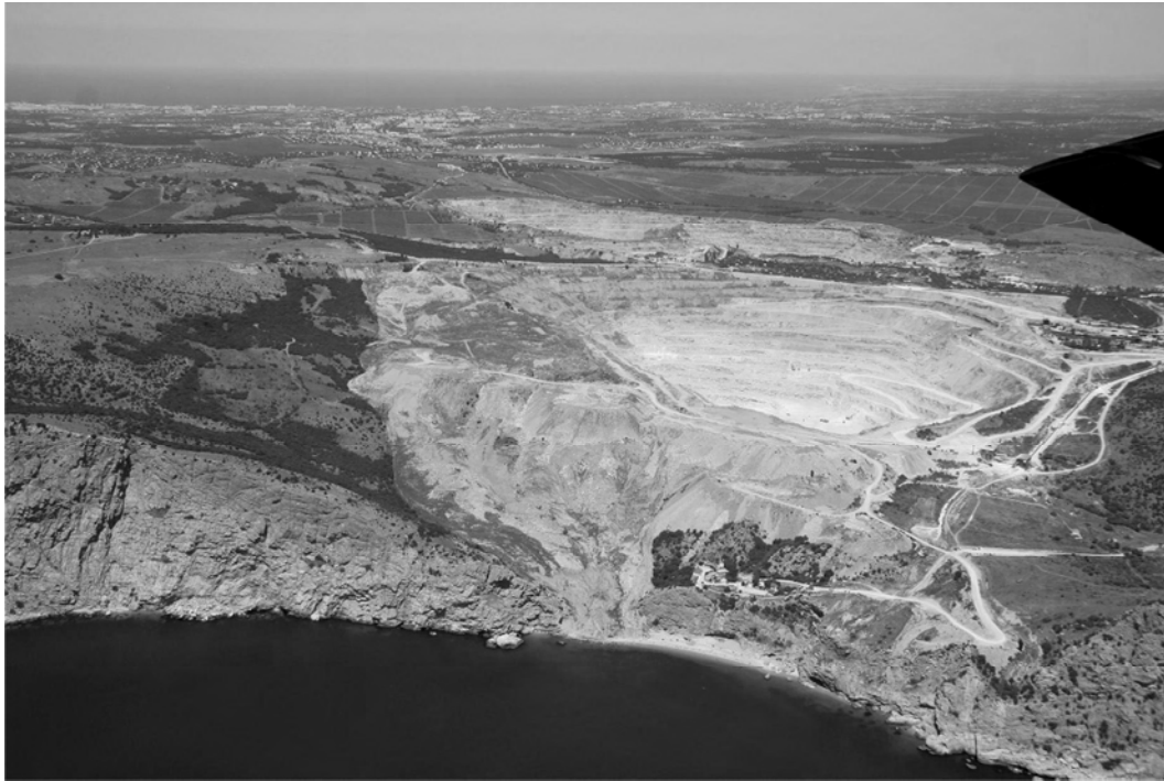
Рис. 2. Техногенный оползень № 1648