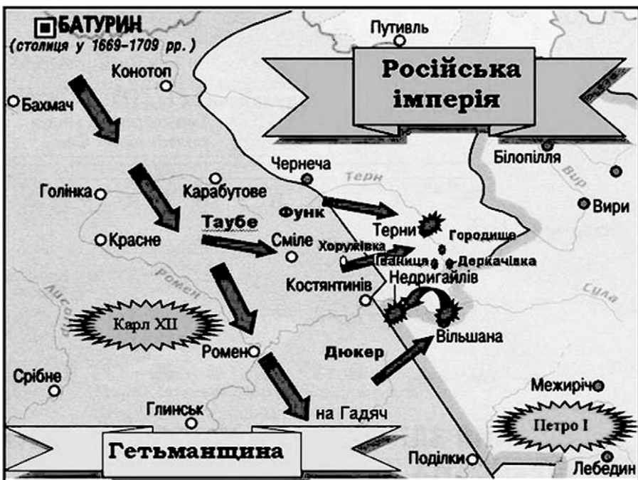
Карта бойових дій шведської армії у листопаді – грудні 1708 р.

Легенда про те, що під час російсько-шведської війни 1708 року недригайлівська фортеця встояла під натиском шведів, розповсюджена і донині. Розповідають, нібито російський самодержець Петро I, довідавшись про те, що містечко Дригайлів витримало штурм шведів, мовив: «Да какой же это Дригайлів, коли не дрогнул». Слово царя – закон, отож відтоді й став Дригайлів Недригайловом. Так розповідає легенда, а як же було насправді?