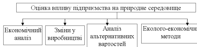
Рис. 2. Основні методи оцінки впливу підприємства на природне середовище.

Найбільш розвинутими методами оцінки впливу підприємства на природне середовище в ракурсі впливу на якість продукції підприємства, є методи, що представлені на рис. 2. Ці методи носять узагальнюючий характер і не враховують галузевої специфіки підприємств, сфери їхньої діяльності, у зв'язку з чим мають широке застосування.