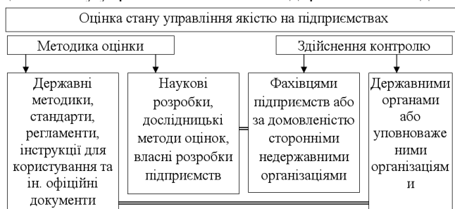
Рис. 1. Основні підходи до оцінки стану управління якістю на підприємствах.

Основні підходи до оцінки стану управління якістю на підприємстві наведені на рис. 1.