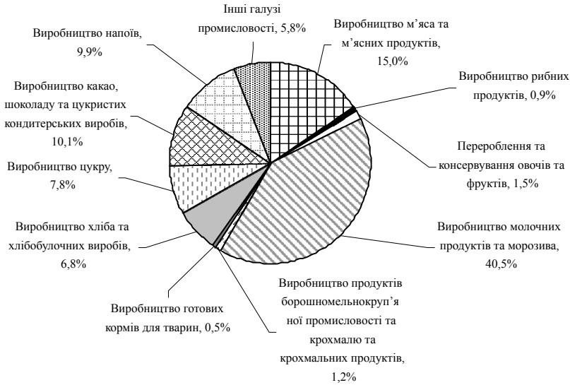
Рис. 1. Структура реалізованої продукції у виробництві харчових продуктів, напоїв за видами діяльності у Житомирській області у 2005 р., % [3]